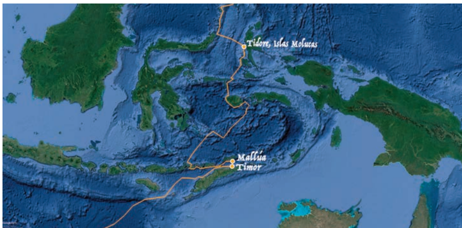
Tránsito de las Molucas a Timor, antesala del trayecto más duro al que hubo de enfrentarse Elcano.

Tras permanecer 37 jornadas en una isla sin identificar entre Brunéi y Palawan para reparar y calafatear las naves, a esas alturas muy maltrechas, acordaron la destitución de Carvalho por algunos casos oscuros de corrupción y el nombramiento de Espinosa (que ya era capitán de la Trinidad ) como capitán general de la flota. Juan Sebastián de Elcano, por su parte, fue nombrado capitán de la Victoria . Con esta nueva organización cesó la deriva en los rumbos y las dos naves llegaron finalmente a Tidore, en las Molucas, el 8 de noviembre. En Tidore los expedicionarios encontraron un rey, Almansur, con mucha predisposición a comerciar con ellos, y lo que resultó mejor, leal a los pactos contraídos. Durante algo más de cuarenta días las dos naos cargaron todo el clavo que pudieron almacenar, aunque a la hora de la salida la Trinidad hacía agua de manera peligrosa por lo que hubo de permanecer en la isla reparando durante cuatro meses, transcurridos los cuales inició el viaje de regreso por el este en dirección a Castilla del Oro, pero los vientos contrarios, los fuertes temporales y la falta de alimentos los obligaron a regresar a Tidore, donde fueron capturados por los portugueses que los sometieron a trabajos forzados tan duros que únicamente sobrevivieron tres hombres. Al mando de Juan Sebastián de Elcano, la Victoria zarpó de Tidore el 21 de diciembre con 47