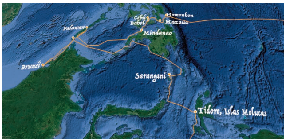
Periplo a lo largo del archipiélago filipino.

Huérfanos de su comandante, la expedición navegó durante días como espíritus errantes bajo el mando del portugués Lopez Carvalho. Igual que su predecesor y también sin razones aparentes, Carvalho abandonó el rumbo sur que debía conducirles a la latitud de las Molucas y se dedicó a deambular de isla en isla por el mar de Joló. Desconfiados, desembarcaron solo cuando la falta de alimentos o agua resultó acuciante. De este modo visitaron la isla de