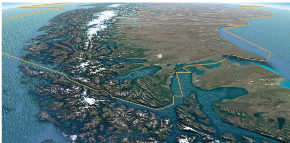
Estrecho de Todos los Santos, posteriormente rebautizado como de Magallanes.

En los 34° de latitud sur los marinos exploraron el mar de Solís (Estuario del río de la Plata), rebautizado así cuando el piloto mayor de la Casa de la Contratación Juan Díaz de Solís encontró allí la muerte a manos de indios caníbales tres años atrás cuando buscaba el paso al Mar del Sur. Obviamente, Magallanes tampoco lo encontró y como quiera que muchos susurraban que el portugués había asegurado al rey Carlos que aquel era el lugar de encuentro de ambos mares, las murmuraciones aumentaron y la convivencia alcanzó los límites de lo tolerable. El 1 de abril de 1520 las naves se refugiaron en la ensenada de San Julián, en los 49° sur, dispuestas a dejar pasar el invierno austral. En ese momento la situación era de tal tensión que no tardó en producirse el motín, que pudo ser sofocado gracias a la ayuda de Gonzalo Gómez de Espinosa, alguacil de la expedición, aunque significó la muerte, entre otros, de Quesada y Mendoza, y la prisión de Cartagena, al que, dada su encumbrada posición y cercanía a Fonseca, de quien algunos aseguraban que era hijo natu-