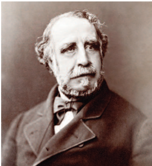
Mariano de las Mercedes Roca de Togores y Carrasco, ministro de Marina, marqués de Molins.

En 1848 se dieron las circunstancias para que se pudiese restablecer el Cuerpo. La recuperación de la economía se había iniciado y la situación política interior estaba estabilizada. El nuevo ministro de Marina, el marqués de Molins, inició la reconstrucción de la Fuerza Naval e introdujo una serie de reformas. Entre ellas estaba la creación de un Cuerpo de Técnicos Superiores conforme al modelo francés. También se contrataría a un miembro del Cuerpo de Ingenieros de la Marina francesa para que repitiese la tarea de Gautier. No se