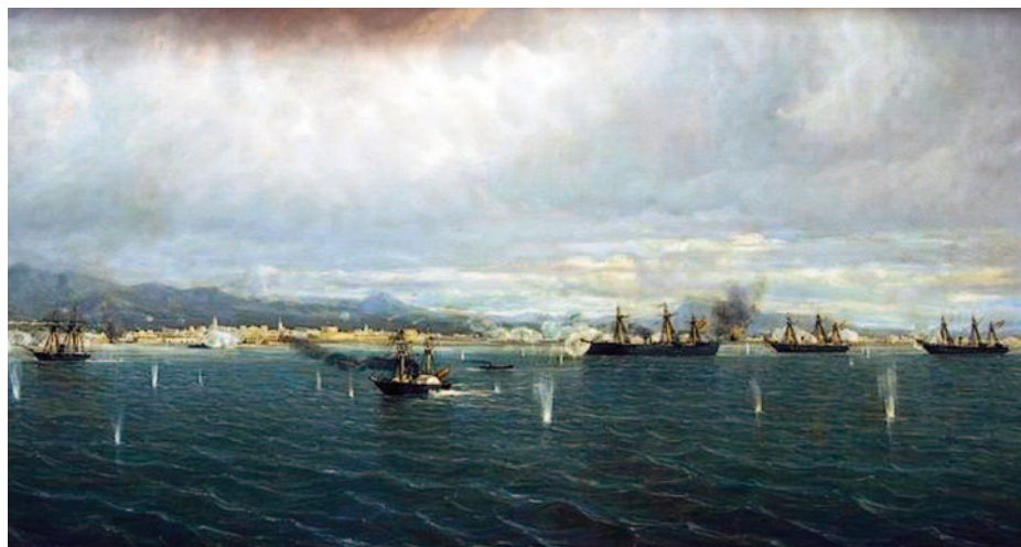
Pintura de Rafael Monleón que representa el bombardeo de El Callao. En el centro, la Numancia . (Museo Naval de Madrid).

La otra circunstancia que dificultó su labor fue el subdesarrollo de la industria naval española. Una de las principales dificultades de la construcción en los arsenales era el suministro de maderas. En el siglo XVIII la Armada controlaba los bosques y los transportes, y uno de los cometidos principales