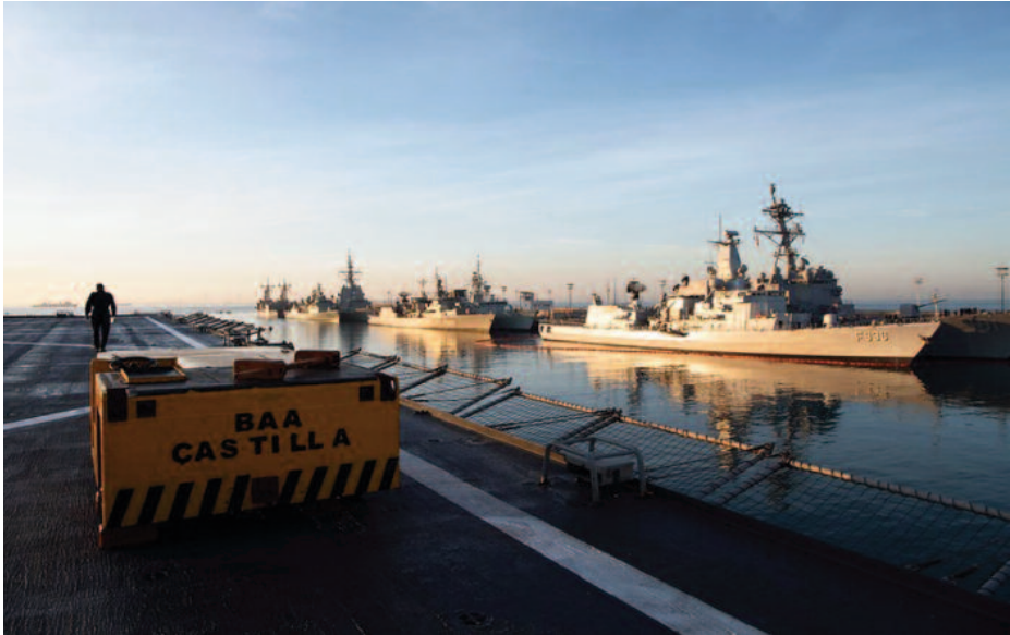
Pre sail Conference en Rota: FLOTEX-19.