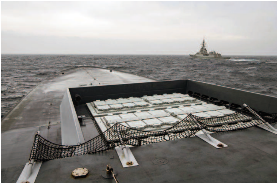
Fragatas de defensa aérea en el Ejercicio FLOTEx-19.

Si bien todos los retos anteriores son obvios y no necesitan aclaración, me gustaría hacer un pequeño comentario sobre el último de ellos. Para generar los estados mayores que se han descrito anteriormente, es condición sine qua non que las plantillas y el personal de refuerzo estén completamente dotados,