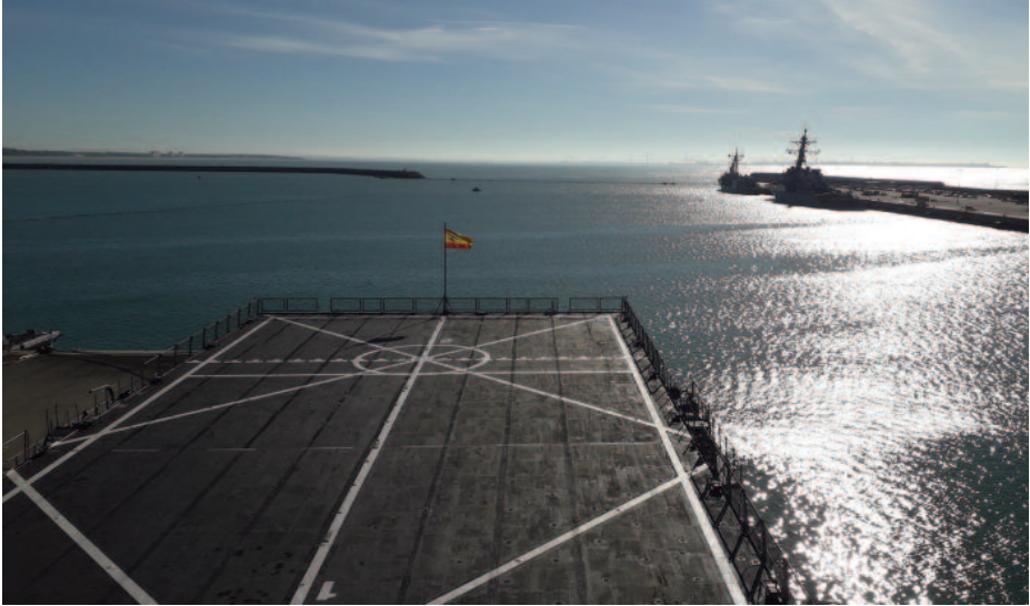
Base Naval de Rota, diciembre de 2020.

que se le añadirá el personal aliado destinado en el SPMARFOR para operaciones combinadas. Cuando el mando lo ejerza el COMGEIM, se le sumará el personal de Infantería de Marina (identificado en la plantilla ad hoc ).