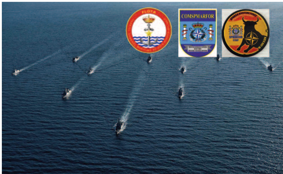
NRF 2020 bajo mando del COMCGMAD en el Ejercicio FLOTEX 2019. CGMAD.

HQ-HRF, capaces de ejercer el Mando y Control de sus respectivos componentes de la NRF.