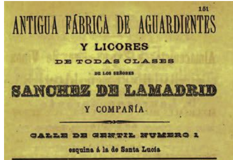
Anuncio publicado en la Guía Oficial de Cádiz. Pueblos de la Provincia. Departamento Marítimo para el año 1896, p. 151.

Y el vino, bebida casi de salvación, también corrió, cómo no, en esta alegría, ya que el lunes 19 «se repartió a la Maestranza el vino donado por la Unión Montañesa de San Fernando para solemnizar la botadura del Princesa de Asturias » (58).