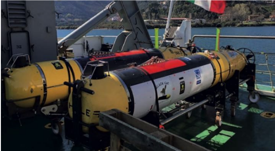
UUV Muscle y Black Cat del CMRE de la OTAN.

se multiplicarán de forma exponencial. Se reduce el peligro de las dotaciones al mantener distancia con la zona de influencia del adversario y se minimizan las vulnerabilidades de la plataforma ante escenarios con amenaza multidominio, puesto que se mantendrían próximas a las unidades de mayor desplazamiento que, actuando como goalkeepers , dispondrían per se de buenos y efectivos sistemas de autodefensa extendida. Asimismo, el personal de las dotaciones de los cazaminas podría focalizarse exclusivamente en el control de sus artilugios que, de forma remota, harían el principal esfuerzo en la lucha contra minas.