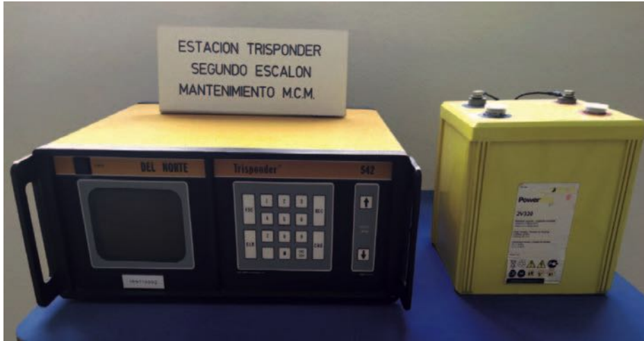
Estación Trisponder. (Edificio de la Fuerza de MCM).

ante una posible acción de fuerzas convencionales o asimétricas durante los períodos de caza de minas.