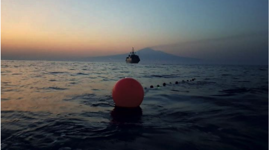
Cazaminas Segura recogiendo baliza.

En un futuro, en el caso de que la negación de la señal de los GNSS se focalice en impedir el posicionamiento de los vehículos autónomos, se deberá considerar la necesidad de que se integren a bordo unos sistemas fiables de navegación inercial que permitan operar el mayor tiempo posible con independencia de las actividades de perturbación del adversario. Los vehículos autónomos actuales disponen de sistemas inerciales precisos, pero que necesitan refrescar su posición periódicamente a través de la señal GNSS que reciben acústicamente o haciendo superficie.