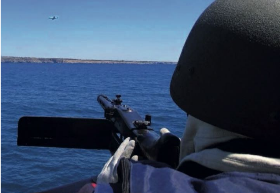
Ejercicio de FORCE PROTECTION en el cazaminas Segura durante ESP MINEX-18.

través de la perturbación de la señal de los GNSS (8). Al operar con artefactos remolcados y sumergidos en aguas someras, se pone en alto riesgo la seguridad de los mismos y de la propia plataforma, puesto que los espacios disponibles para maniobrar son de por sí reducidos cuando se está operando dentro de un campo supuestamente minado.