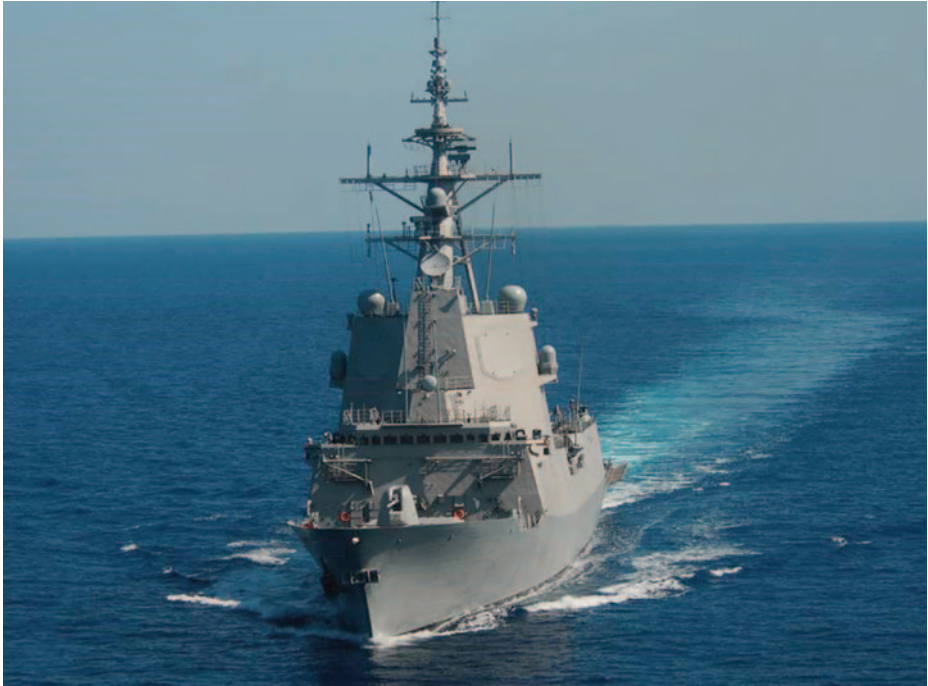
Fragata Cristóbal Colón .

integración de estos sistemas, tras dicho gasto inicial su mantenimiento es muy reducido por lo que su efectividad se hallaría vigente con el paso del tiempo; la simplificación de accesos a sistemas, es decir, el disponer de un solo medio o sistema para acceder a multitud de locales o entornos en lugar de tener que emplear una contraseña diferente en cada sistema o local.