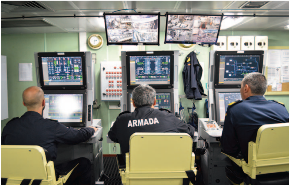
Fragata Cristobal Colón durante su participación en la agrupación naval permanente SNMG-2.

de misiles, torpedos y el montaje de artillería. En ella se situarían también los puestos de los controladores aéreos, tanto el de helicópteros como el de interceptación. Estos puestos de supervisor estarían ocupados principalmente por suboficiales y, en algún caso, cabos primeros.