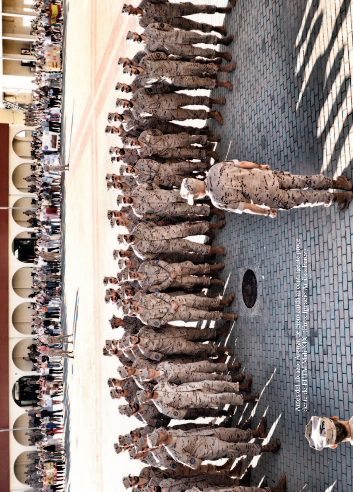
Antes del abrazo. Arrenga de bienvenida al contingente proce- dente de EUTM Mali XIX.