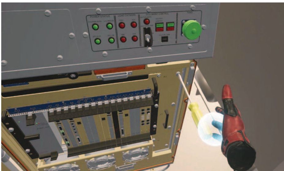
Ejemplo de la función de adiestramiento del Gemelo Digital.