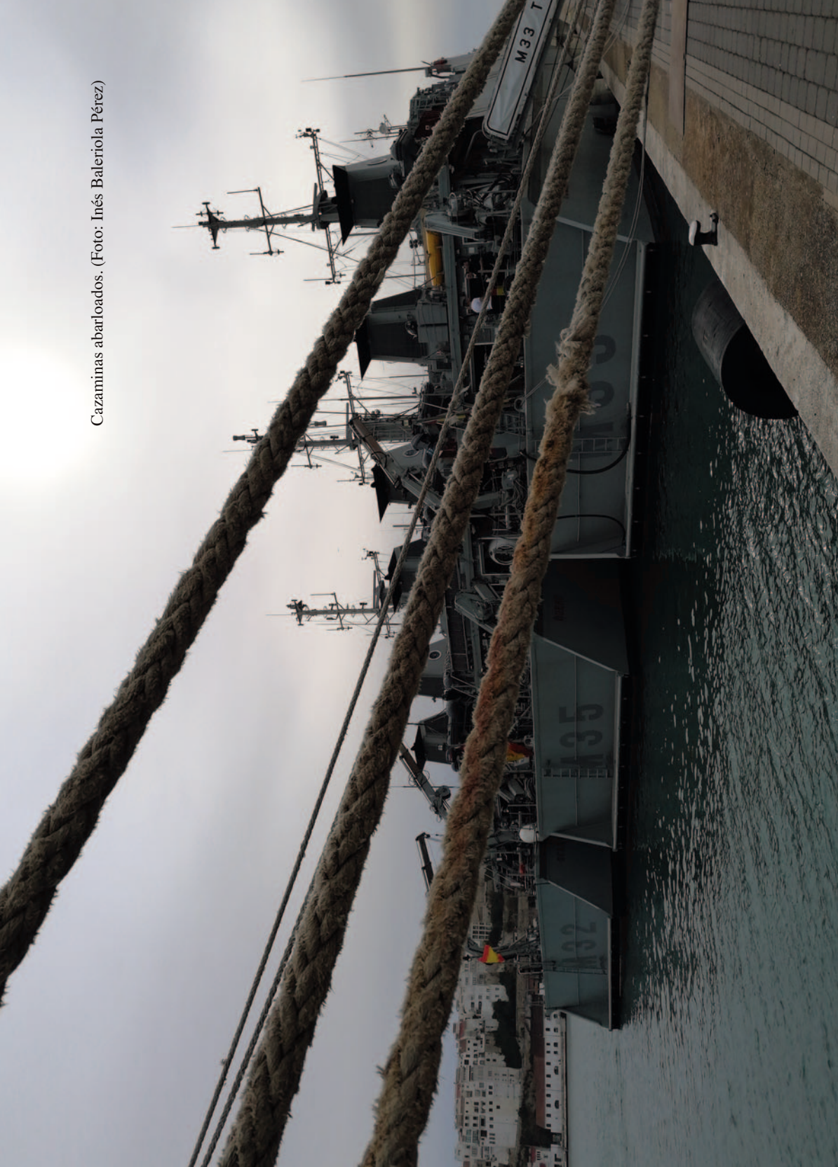
Cazaminas abarloados.