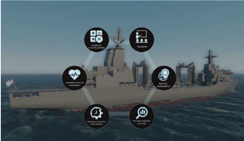
Ejemplo de interfaz del Gemelo Digital.

Para las unidades de nueva construcción se pretende desarrollar un Gemelo Digital específico, con su propia configuración para cada una. A su vez, existirán tres plataformas sincronizadas durante todo el ciclo de vida donde residirá el Gemelo Digital: