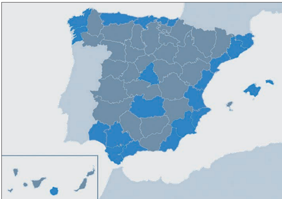
Figura 2. En azul distribución del patrimonio de la Armada.

Fruto de siglos de historia, éste se ha ido adquiriendo en el tiempo en torno a siete áreas geográficas: Madrid, ría de Ferrol, bahía de Cádiz, Cartagena, Las Palmas de Gran Canaria, Baleares y Marín, a las que hay que añadir el conjunto de comandancias y ayudantías navales distribuidas a lo largo del litoral (figura 2).