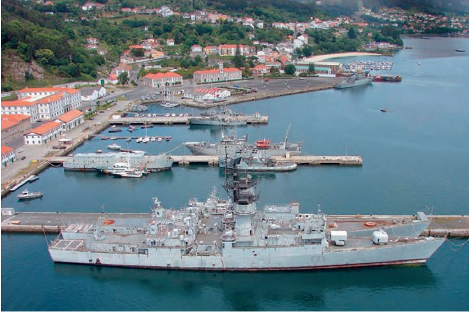
Vista de la Estación Naval de La Graña.

Estando previstas en un futuro cercano las siguientes: Arsenal de Cartagena, Escuela Naval Militar, Estación Naval de Puntales, Estación Radio de Bermeja, Estación Naval de La Algameca, Estación Radionaval de Santorcaz, Estación Naval de Mahón y Arsenal de Las Palmas.