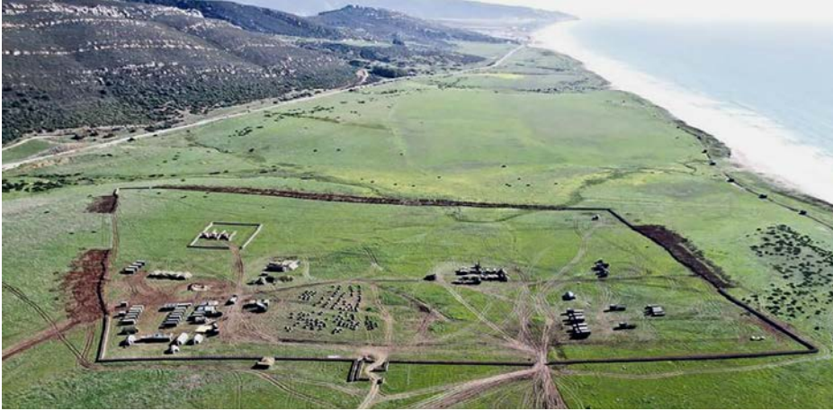
Campo de Adiestramiento de la Sierra del Retín.

Campo de Adiestramiento de la Sierra del Retín y la Base Naval de Rota en Cádiz; las Estaciones Radio de Bermeja y Santorcaz en Madrid; la Estación Naval de La Graña y la Cantera del Vispón en La Coruña; la Estación Naval de Mahón en las islas Baleares; los polvorines de La Algameca, Tentegorra y Coto Roldán en Murcia; la Estación Radio de Guardamar en Alicante, así como la isla de Alborán y de los Terreros (Almería) y la isla del Pino, situada frente al Arsenal de La Carraca.