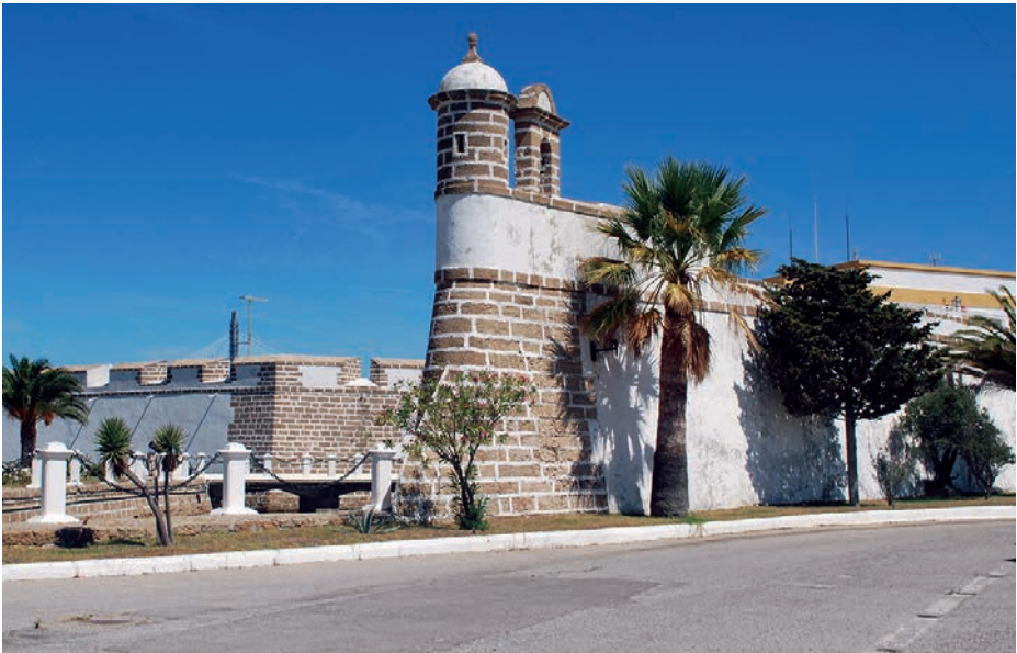
Castillo de San Lorenzo.