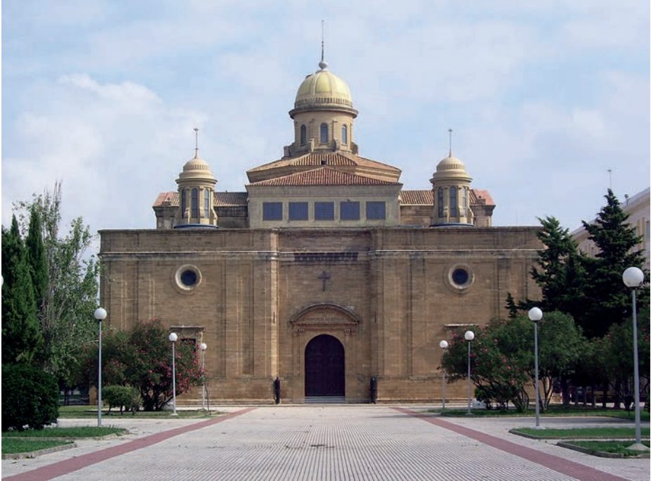
Panteón de Marinos Ilustres.

Palacio de los Marqueses de Santa Cruz. Archivo General de Marina «Álvaro de Bazán», donde se custodian los fondos documentales anteriores a 1875 pertenecientes a archivos de la Armada o de otros departamentos. Ubicado en Viso del Marqués (Ciudad Real), dispone de un total de 1.105 m 2 de superficie, con 11.564 metros lineales de documentos.