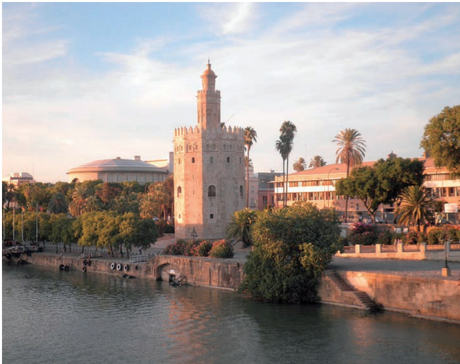
Torre del Oro.

Torre del Oro. Símbolo de Sevilla y la más famosa torre militar almohade que se conserva en España; es la única superviviente de las que integraban el recinto amurallado construido hacia el año 1221.