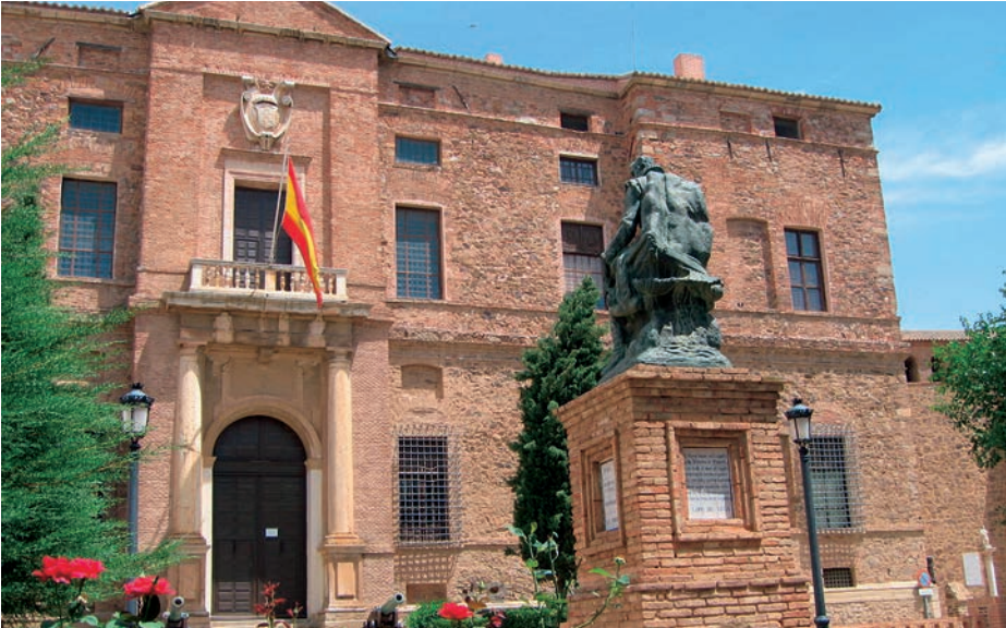
Palacio de los Marqueses de Santa Cruz.