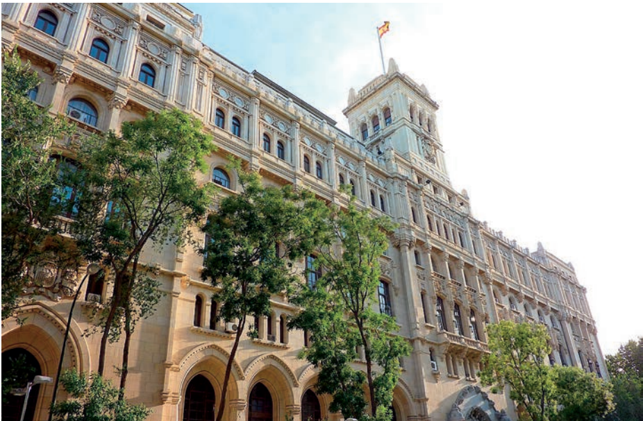
Cuartel General de la Armada.