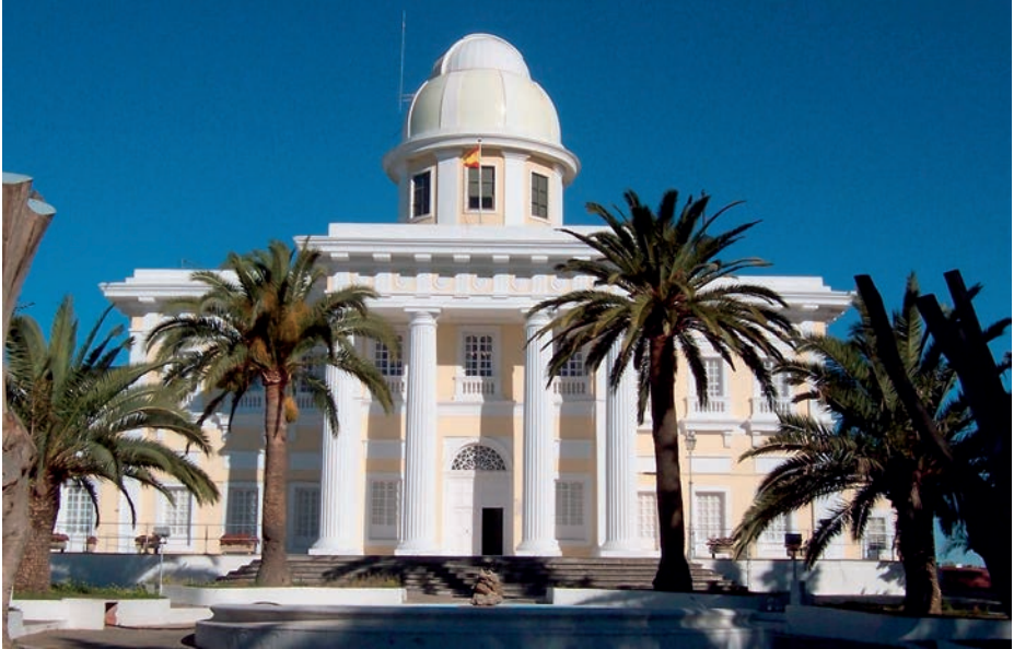
Real Instituto y Observatorio de la Armada.