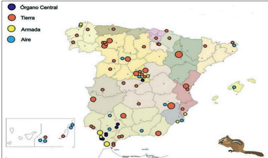
Figura 1. Distribución geográfica del patrimonio del Ministerio de Defensa.

elementos de urbanización, con el siguiente reparto: el 55 por 100 corresponde al Ejército de Tierra, el 17 por 100 a la Armada, el 15 por 100 al Ejército del Aire y del Espacio, y el 13 por 100 distribuido entre el Órgano Central y el Estado Mayor de la Defensa (SINFRADEF, noviembre de 2022).