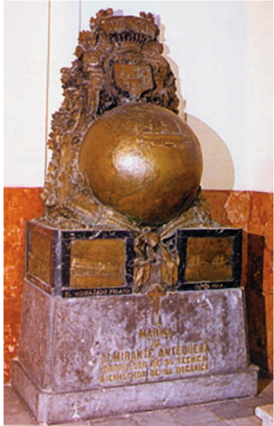
Mausoleo de Juan Bautista Antequera y Bobadilla.