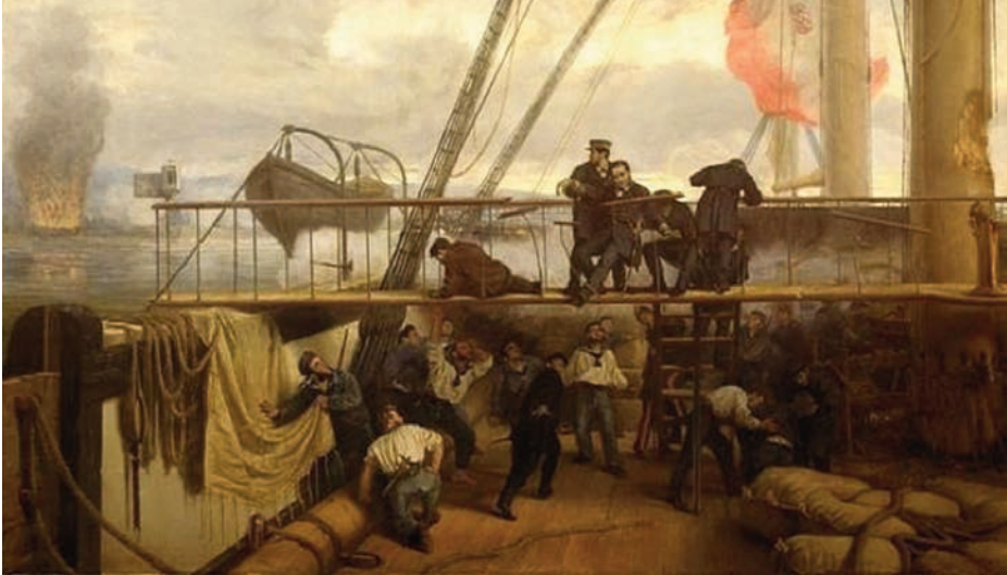
Méndez Núñez a bordo de la fragata Numancia cae herido en el bombardeo al puerto de El Callao. (Óleo de Antonio Muñoz Degraín. Museo Naval)

de Abtao, Callao o el barrio del Pacífico. Antequera es condecorado con la Medalla Conmemorativa de la Campaña del Pacífico o Bombardeo de El Callao y recibe un nuevo ascenso a capitán de navío.