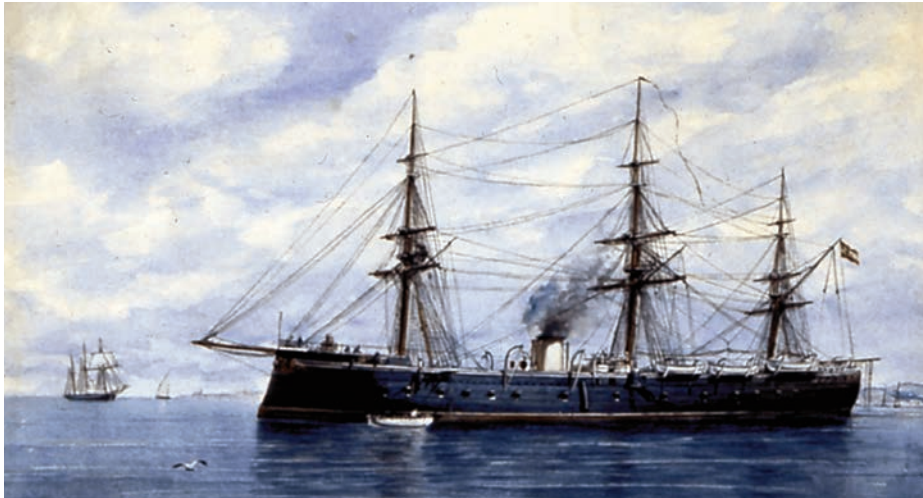
Fragata blindada Numancia .

condecorado con la Medalla del Viaje de Circunnavegación y ascendido a brigadier.