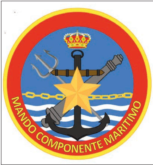
Emblema del MCM 3*.

En el ámbito específico, las principales referencias son la Instrucción 15/2021, de 11 de marzo, del AJEMA, por la que se desarrolla la organización de la Armada; la NPOR 1/2021 del ALFLOT, por la que se implanta la estructura orgánica de la Flota, y el Concepto de empleo del CGMAD de 2019, del ALFLOT. Estas referencias desarrollan los cometidos y responsabilidades del CGMAD, que en lo relativo al tema que nos ocupa se pueden resumir en los siguientes: