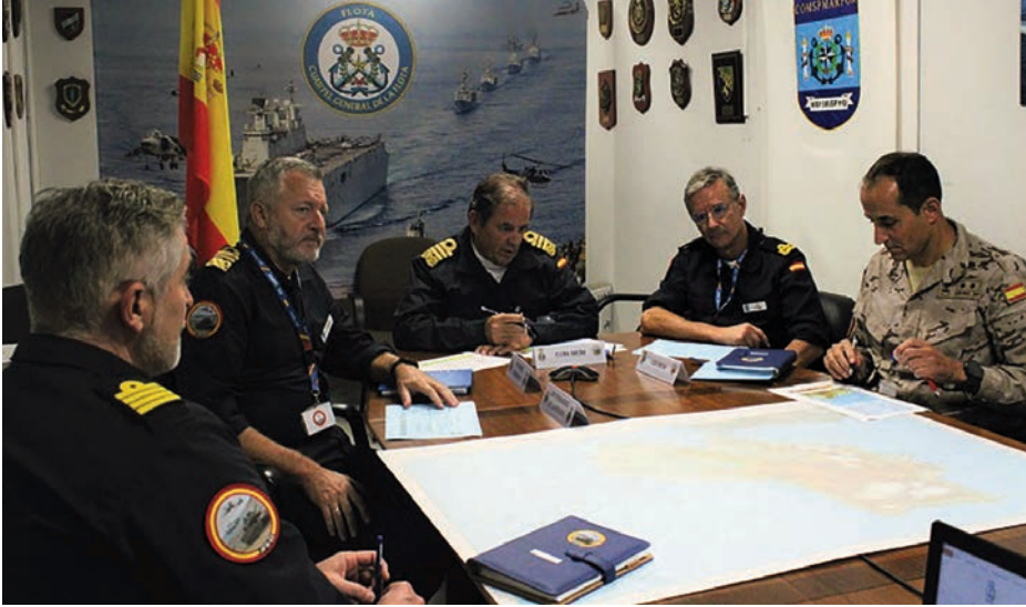
Ejercicio JFX-22, noviembre 2022.

El JFX-22 ha significado además para la Armada la activación por primera vez del Mando Componente Marítimo de nivel 3 (MCM 3*), bajo mando del ALFLOT, con el CGMAD como núcleo generador, reforzado con personal de aumento procedente de otras estructuras de la Armada y empleando las instalaciones disponibles en el Cuartel General de la Flota. Si bien el resultado se puede considerar satisfactorio en líneas generales, el ejercicio ha dejado entrever nuestras «costuras», especialmente en lo relativo a la falta de «agilidad» para generar y activar una estructura de este tipo, lo cual no es inherentemente negativo, sino que, como casi todo en la vida, produce dos noticias: una buena y una mala. La buena es que somos conscientes de en qué fallamos y cuáles son las posibles soluciones. La mala noticia es que, aunque duela reconocerlo, en la Armada nos estamos quedando claramente atrás en relación al resto de MM. CC. Corremos por tanto el riesgo de que lo que hace dos años era un acierto se convierta en una de tantas buenas ideas que se quedan por el camino por falta de empuje.