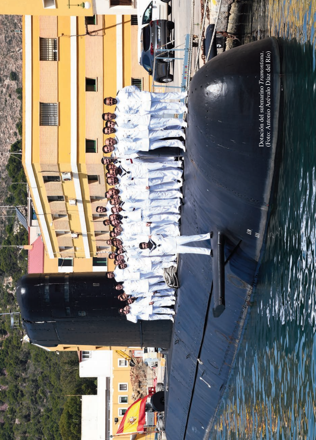
Dotación del submarino Tramontana .