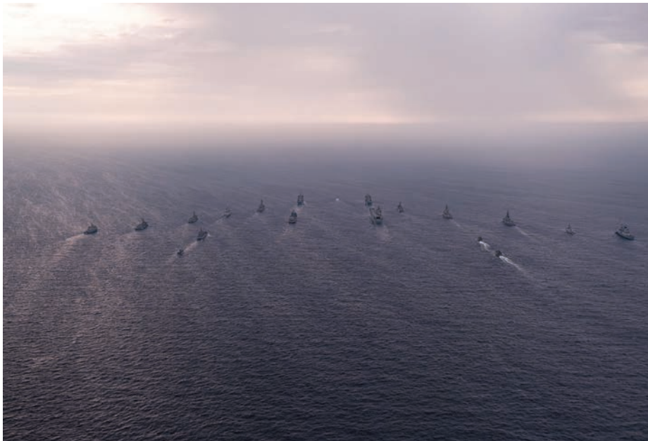
Formación de buques durante el ejercicio FLOTEX-23.

personal de aumento con puestos a cubrir en el MCM 3*. De este modo, disponiendo del material y la infraestructura necesarios, su integración se podría llevar a cabo en modo plug and play , facilitando su adiestramiento previo y eliminando los potenciales retrasos en la generación, activación e integración.