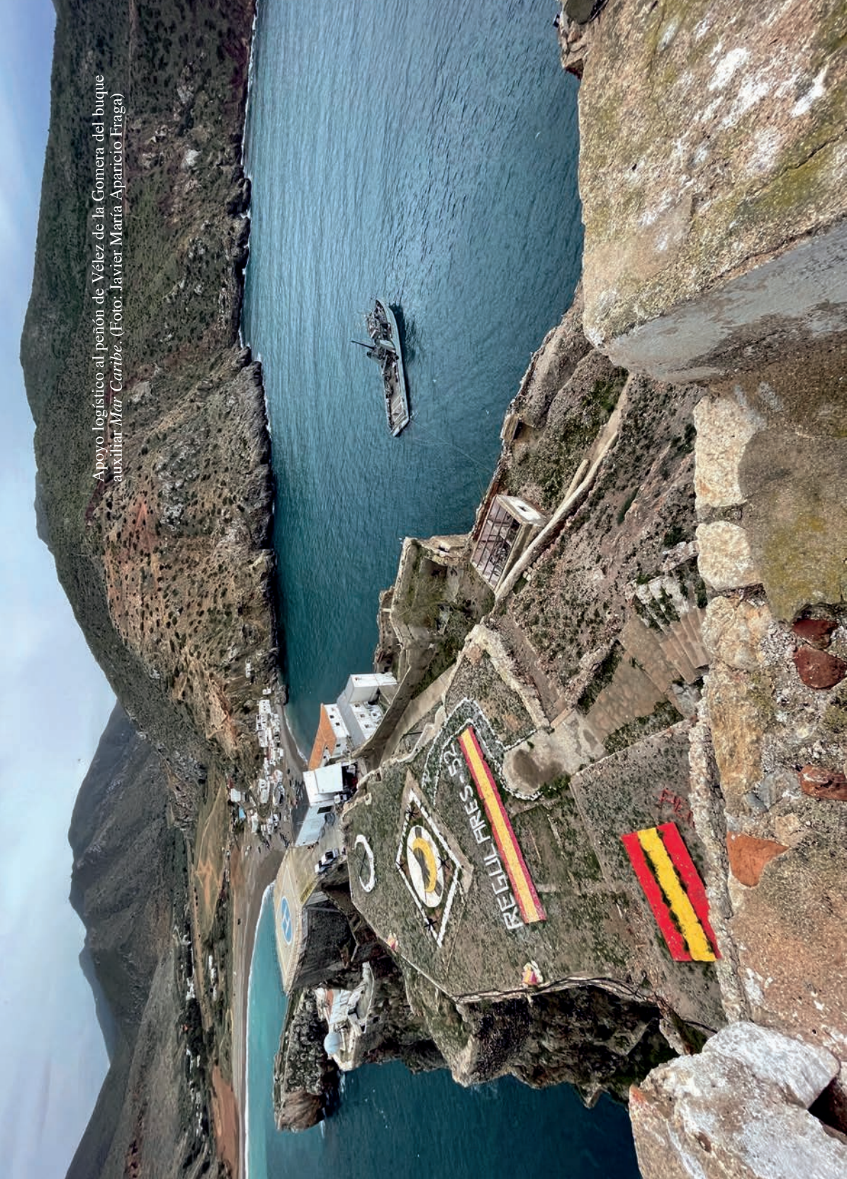
Apoyo logístico al peñón de Vélez de la Gomera del buque auxiliar Mar Caribe.