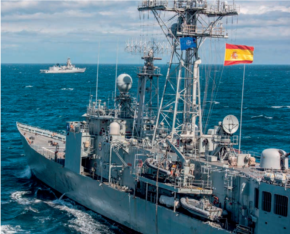
Fragata Victoria .

presentes sobre el terreno y constituyen una amenaza latente para la seguridad marítima internacional. Los recientes secuestros del mercante maltés, de 45.000 toneladas, y de las embarcaciones tipo dhow , de las que todavía se desconoce su paradero, verifican que el patrón recurrente del empleo de mother ships (embarcaciones madre) para realizar ataques a más de 400 millas de costa continúa vigente, lo que les permite fondear su «presa» en el litoral somalí (Galmudug o Puntland) sin ninguna interferencia hasta que finalizan la mediación para el rescate económico.