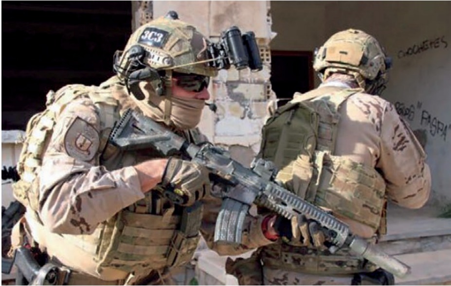
Ejercicio de la FGNE.

trasladó del Reino Unido (Northwood) a la base Naval de Rota, y desde entonces España está liderando la operación con eficacia y en continua adaptación a la evolución de las amenazas en la región, como demuestran su participación en la evacuación de 162 ciudadanos europeos atrapados en Puerto Sudán en mayo de 2023 a raíz de la guerra civil en la que está inmerso el país o la reciente actuación en diciembre de 2023 de la fragata Victoria , que permitió a las fuerzas policiales somalíes intervenir sobre los piratas sospechosos y liberar a la tripulación del pesquero Al-Meraj 1 sin causar bajas.