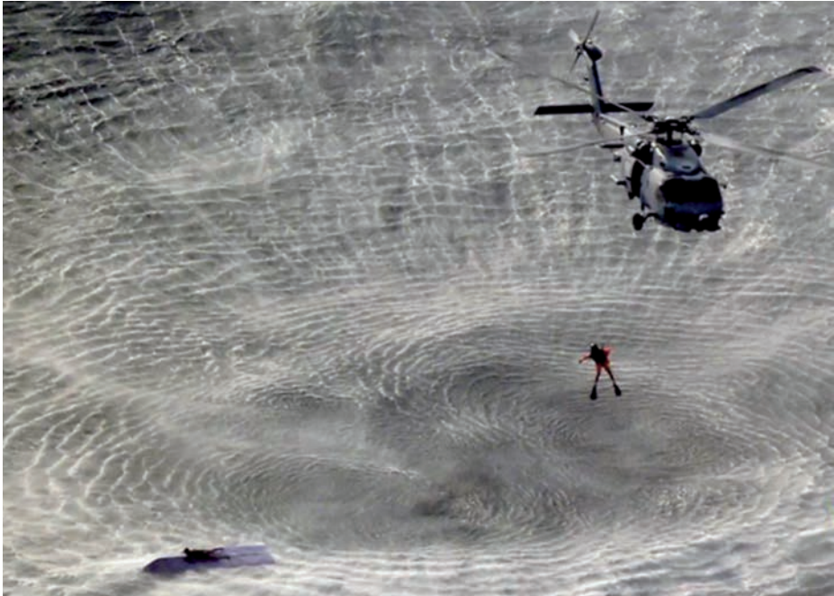
Rescate tras el naufragio de un dhow yemení.

Destacar que Atalanta identificó una clara conexión de las redes de piratería (5) con las diferentes actividades ilícitas de carácter transnacional en la