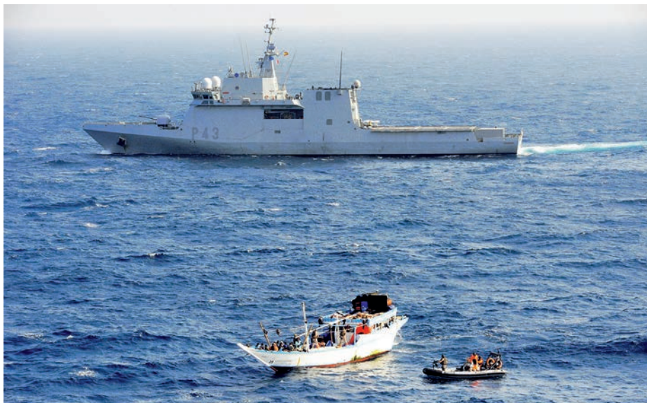
BAM Relámpago en la Operación Atalanta.

diciembre, sino por la repercusión que está teniendo sobre la seguridad internacional cualquier actuación disruptiva que sucede en su área de operaciones, un hervidero de inestabilidad, tanto en la mar como en tierra firme, que ni a corto o medio plazo se prevé que mejore, sino al contrario, ya que constituye, cada vez más, uno de los tableros de competición más activos para romper el statu quo internacional, como últimamente ha quedado patente en el mar Rojo y en 2019 en el estrecho de Ormuz. Por ello, es determinante identificar a los actores y los intereses de cada parte y su conexión con otros escenarios para poder anticiparse o evitar retrocesos respecto a los logros conseguidos previamente, sin renunciar a la adaptación y a la estrecha colaboración con nuestros aliados y amigos en defensa de la legalidad internacional.