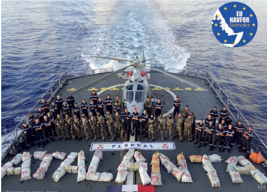
Apresamiento de drogas.

al tener sus raíces y dirección en tierra firme. La situación de Somalia y su organización tribal en clanes dificultan cambiar el entorno que alimenta la regeneración de la piratería, con un repunte de ataques y secuestros a partir de noviembre de 2023, entre los que destacan los secuestros del mercante Ruen , de cuatro dhow s aún sin localizar y de otros cinco recientemente liberados. Las cifras parecen inicialmente contenidas, aunque se han disparado con respecto a lo que estábamos últimamente acostumbrados, permaneciendo en el momento de la redacción de este artículo al menos 18 personas secuestradas en la costa de Puntland (Somalia) a la espera de un rescate económico (3), aunque hay que destacar la reciente liberación del mercante MV Lila Norfolk por parte de la Marina de la India (4). Estas últimas actuaciones han demostrado que la piratería no está erradicada, que sus capacidades y sus causas siguen