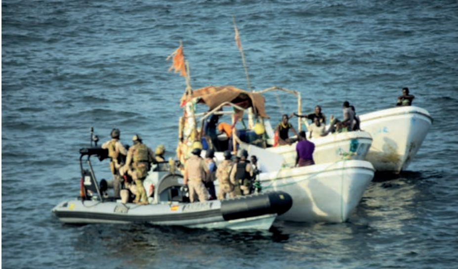
Actuación en las proximidades de Qandala, Puntland.

del desarrollo de sus infraestructuras, como el diseño efectivo de la Ruta de la Seda hacia Occidente o la reciente construcción de su única base fuera de territorio nacional en Doraleh, Yibuti, con una capacidad para 10.000 efectivos. En el océano Índico, la República Federal de Rusia e Irán también realizan despliegues navales, utilizan proxies en la región o incluso tratan de construir bases fuera de su territorio, como la de Rusia en la ciudad de Puerto Sudán.