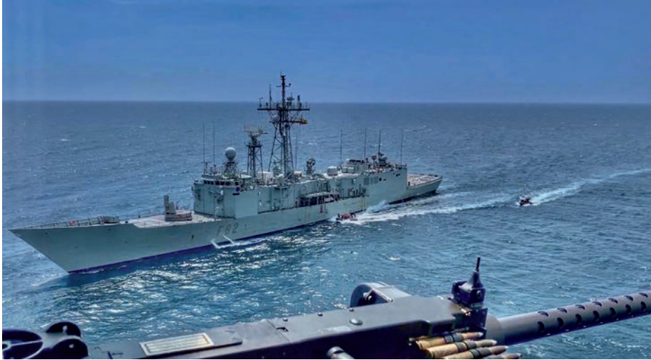
La fragata Victoria en su último despliegue en Atalanta.

Protector u Ocean Shield de la OTAN—, las diferentes generaciones que actualmente están en servicio activo o retiro, desde almirantes a marineros, han navegado en más de una ocasión y en muy diferentes plataformas por las aguas del mar Rojo, golfo de Adén, cuenca de Somalia, mar Arábigo o golfo Pérsico, compartiendo todos ellos experiencias, éxitos, sustos, situaciones más complicadas de lo inicialmente esperado o simplemente recuerdos de camaradería entre ellos o con otras marinas aliadas y amigas.