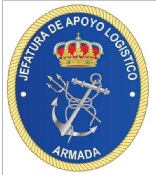
Emblema de la Jefatura del Apoyo Logístico.

Valga pues este breve artículo para rendir homenaje a todos los «logísticos», a su trabajo y dedicación en beneficio de la Armada y, sobre todo, al edificio que los ha albergado durante este tiempo, el gran olvidado, al que nunca se le presta excesiva atención a menos que surja una avería o la necesidad de sustituir una obsolescencia, al que, a pesar de sus achaques, los que aquí hemos trabajado y seguimos haciéndolo tenemos especial cariño y le deseamos que pueda convertirse en centenario, meta hacia la que ya ha recorrido más de la mitad del camino, con el temor por parte de la mayoría de nosotros de no estar aquí, muy a nuestro pesar, para celebrarlo.