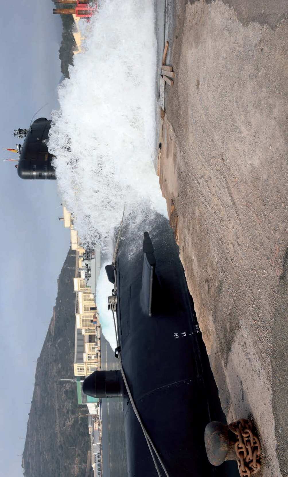
Soplado de tanques del submarino Galerna (S-71).