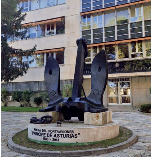
Ancla del portaviones Príncipe de Asturias .

entrada peatonal principal del edificio desde su inauguración.