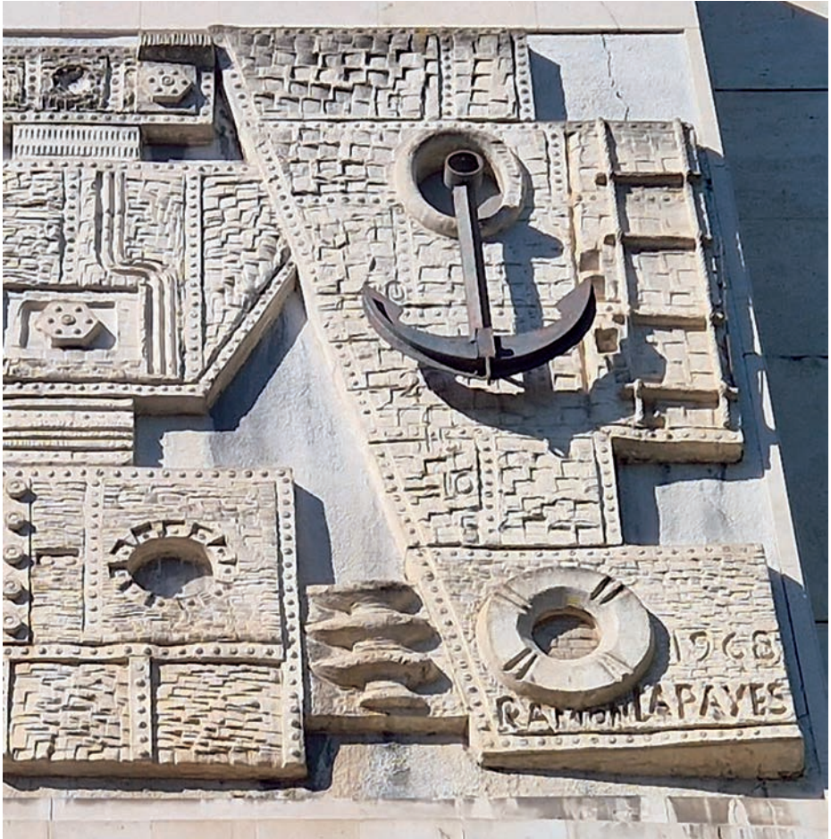
Detalle del mural donde se aprecia el nombre del artista y la fecha de realización.

Así pues, en la zona de la derecha, mirando de frente al mural, vemos la proa de un buque con el ancla a la pendura y una escala de gato, junto con un roscó salvavidas, el nombre del artista y el año de realización, 1968. Un poco más a la izquierda, se identifica lo que podría ser un pañol de munición conteniendo diversos proyectiles, algunas formas de diferente tamaño que bien podrían representar distinta maquinaria y tres ruedas de timón fundidas en hierro. Siguiendo el recorrido hacia la izquierda, se observa claramente una hélice en hierro fundido, dos tubos de ventilación, más maquinaria, algunas tuercas, tornillos y engranajes. Y para finalizar, en el extremo izquierdo, algunos