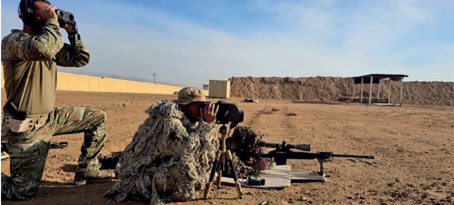
Adiestramiento de tiro de precisión con las fuerzas del Servicio Contrterrorista iraquí.