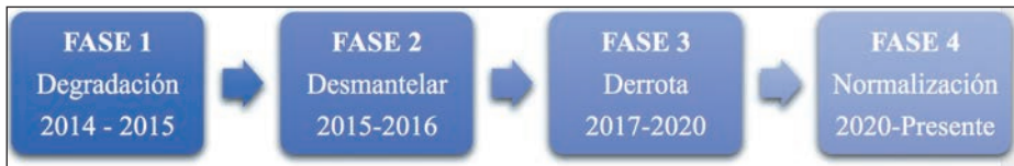
Fases del plan de campaña (1)

El plan de campaña desarrollado para la CJTF-OIR contempla cuatro fases que marcan la evolución de la operación para lograr la expulsión del Daesh. Durante las tres primeras, las fuerzas de la coalición contribuyeron con una intervención directa sobre el terreno mediante operaciones aéreas y golpes de mano contra objetivos del Daesh. Al mismo tiempo, se desarrollaron funciones de entrenamiento y asesoramiento a las fuerzas iraquíes y sirias.