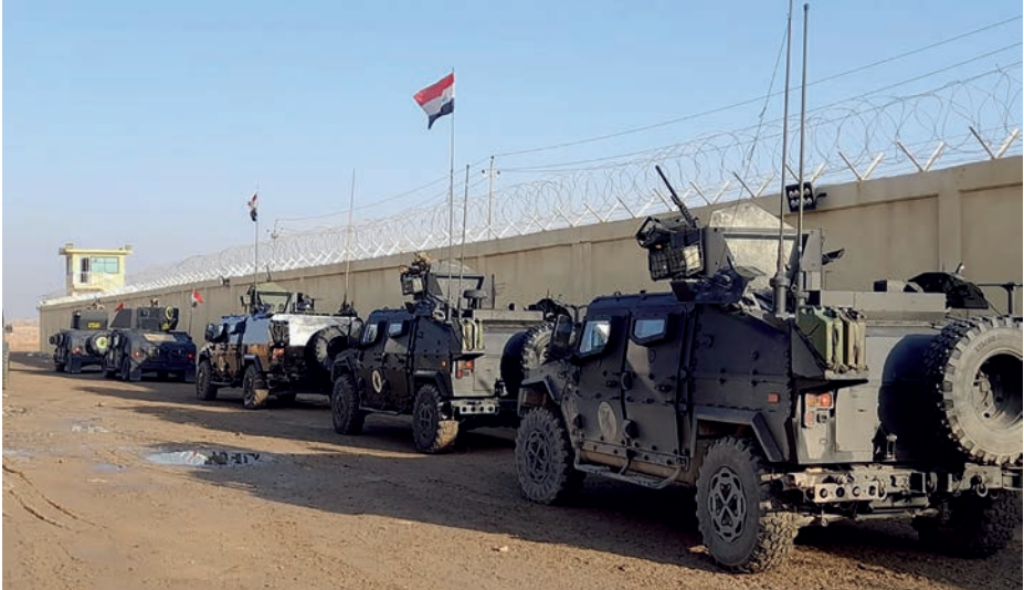
Columna de vehículos del SOTG español y del Servicio Contrterrorista iraquí lista para salir a una operación.

los aspirantes deben superar los módulos de enseñanza de los tres espectros —terrestre, marítimo y aéreo— mediante cursos de largos períodos de tiempo en los que aprenden las tácticas, técnicas y procedimientos de operaciones especiales y, al mismo tiempo, se llevan al límite las capacidades mentales del futuro operador. La FGNE, como unidad de la Armada, desarrolla específicamente las naturales del ámbito marítimo y marítimo-litoral, conformando una fuerza polivalente capaz de realizar sus misiones en dominios terrestres, marítimos y/o aéreos.