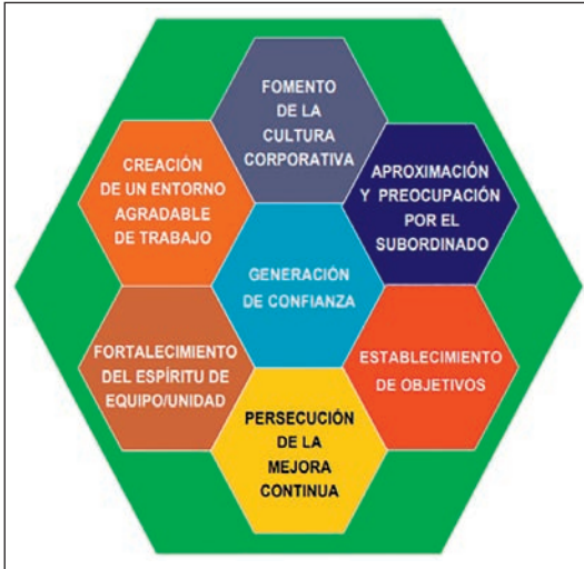
Ilustración 5. Actitudes del líder.

con fuerte ascendente sobre sus subordinados sustentado en el carisma y el prestigio y capaces de enfrentarse a un entorno que cambia rápidamente, muchas veces ante situaciones imposibles de prever». Aunque este modelo se encuentra en revisión por la Jefatura de Personal, se considera vigente en relación con el modelo de liderazgo que necesita la Armada, en el que se destaca la motivación y el ascendente del líder sobre sus subordinados.