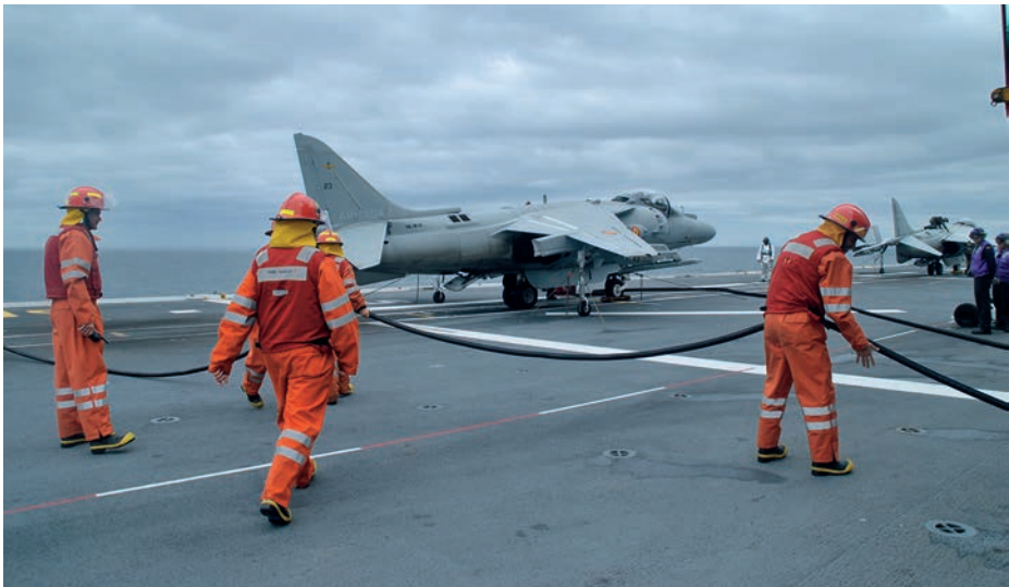
Preparación de la pista de vuelo en el LPD Juan Carlos I .

El concepto de motivación laboral no es nuevo, y desde principios del siglo XX ha evolucionado claramente hacia la búsqueda de la satisfacción personal y la autorrealización. La persona ha pasado de ser un mero recurso a convertirse en