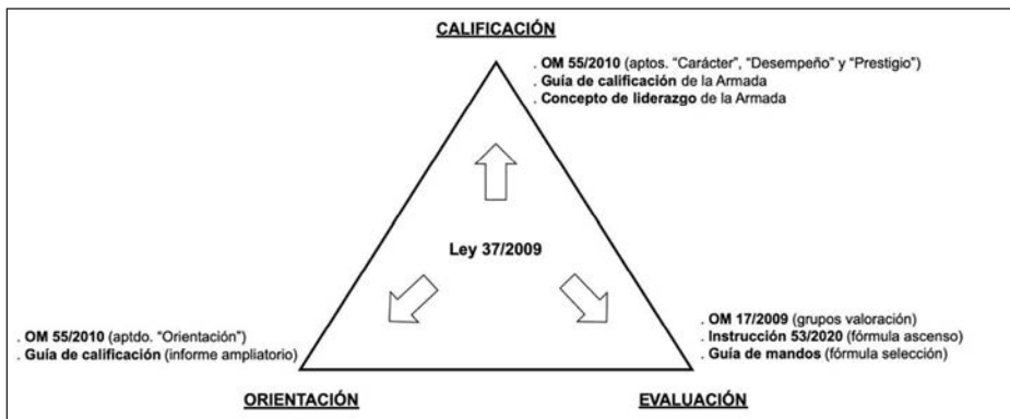
Ilustración 7. Triple objetivo de los IPEC.

Alineado con los factores «hacer sentir importantes» y «hacer sentir útiles», hay un elemento que desde mi punto de vista es fundamental para la motivación: la orientación del personal militar.