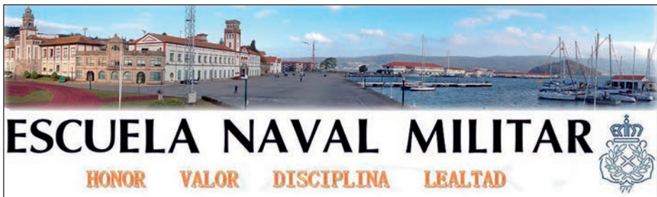
Ilustración 1. Web de la Escuela Naval Militar. Valores

El propósito del presente artículo radica precisamente en reflexionar acerca de la importancia de la motivación en nuestras vidas, sobre todo en el trabajo, de cómo conseguir mantenernos motivados y motivar a las personas de nuestro entorno, alineados con los propósitos de la organización y buscando el bienestar y la satisfacción de los que forman parte de una Armada decisiva, con una alta moral de victoria.