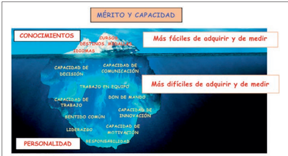
Ilustración 8. Teoría del iceberg.

En este sentido, algunos autores defienden que las competencias recogidas en estos informes se adecúan más a la llamada «teoría del iceberg» que a la realidad. Esta hipótesis se corresponde con las denominadas hard skills , en las que hay una serie de competencias relativas a la personalidad que son más difíciles de adquirir y de medir y, por tanto, no se tienen en cuenta en los procesos de evaluación y selección.