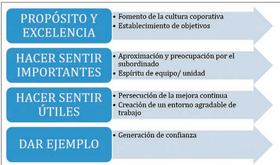
Ilustración 6. Factores de motivación. (Elaboración propia)

referencia para sus líderes; con algunas se nace y otras se adquieren con la experiencia, pero todas se pueden alcanzar mediante el aprendizaje y la motivación.