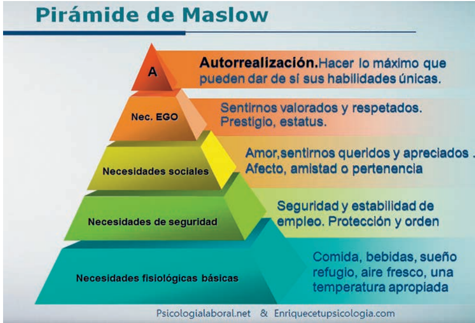
Ilustración 2. Pirámide de Maslow.

de motivación supeditada a una compensación externa (Fischman, 2014).