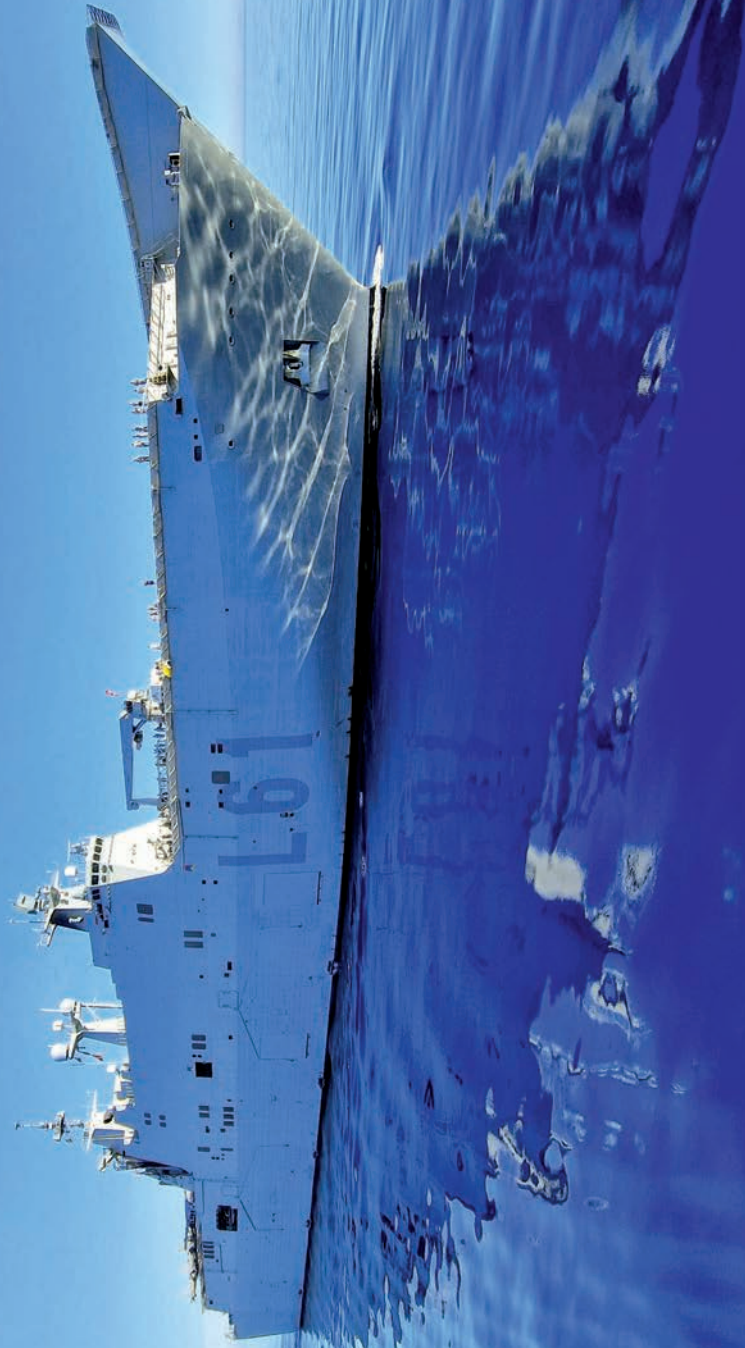
Imagen espectacular y espectacular del buque multipropósito Juan Carlos I navegando al sur de Sicilia durante el despliegue Dédalo-24.