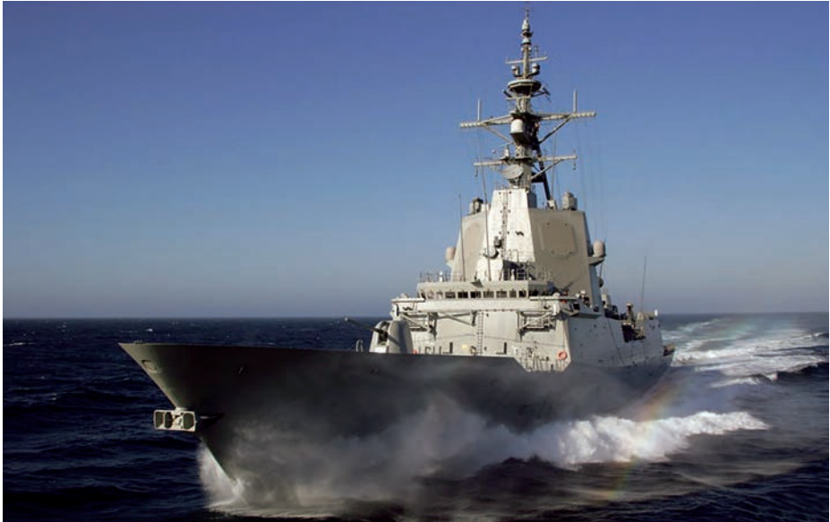
Fragata Almirante Juan de Borbón (F-102).