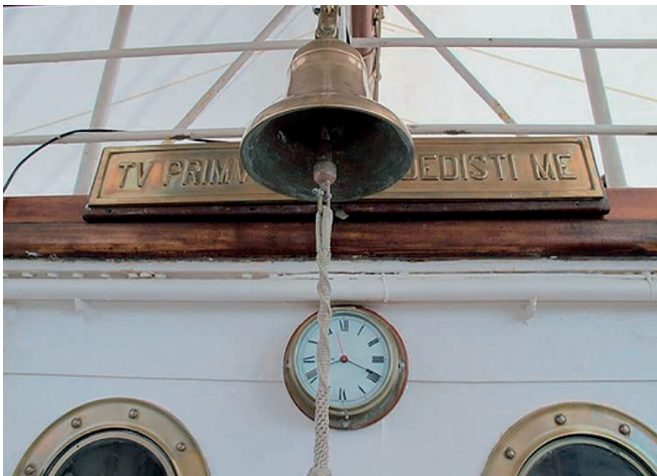
Reloj y campana en la cubierta del Juan Sebastián de Elcano .

La siguiente aplicación de estas tecnologías es saber cuánto tiempo ha pasado entre dos eventos. Medir el tiempo cronometrando de manera precisa es un