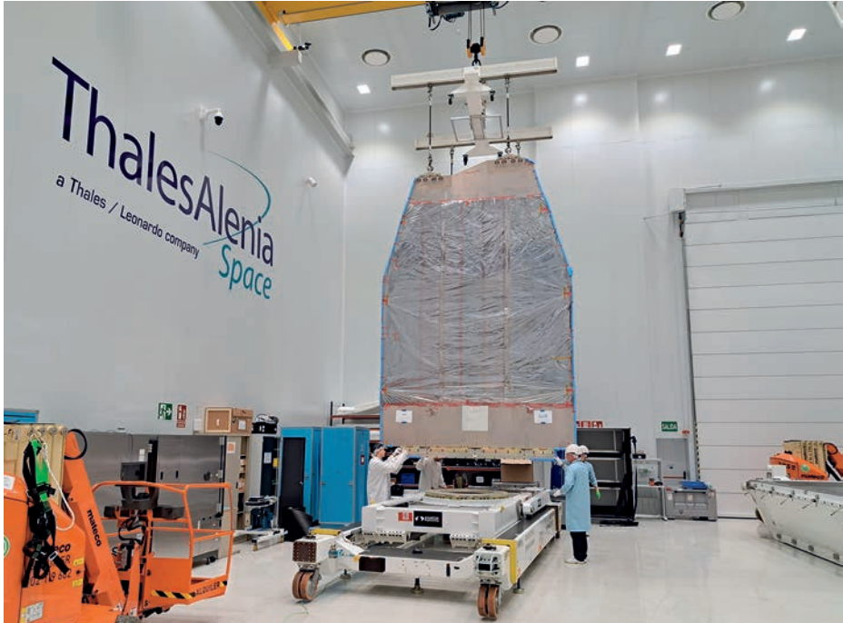
Módulo de comunicaciones del Spainsat NG-I .

fue lanzado el 12 de febrero de 2005 en la posición orbital 29° E; con 12 transpondedores (10) de alta potencia en banda X, tiene dos haces globales, uno fijo y cuatro orientables. Desde el año 2000 Hisdesat ha adquirido el 100 por 100 de la propiedad de este satélite.