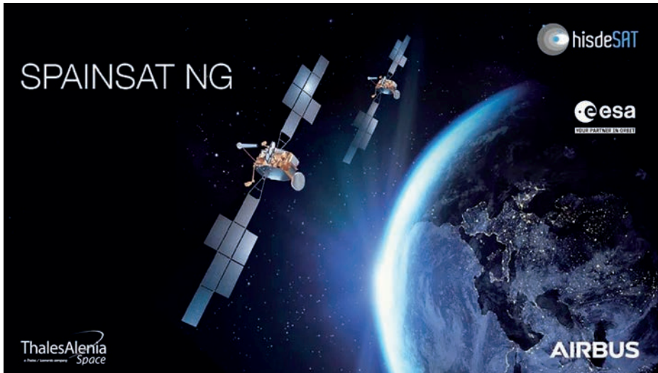
SPAINSAT NG.

a ser el principal medio de comunicaciones del futuro de la defensa. Actualmente se encuentra liderado por Estados Unidos, que desde los años 80 hasta prácticamente hoy en día lo monopoliza, ya sea por el número de satélites propios, por la inversión llevada a cabo o bien por la tecnología empleada. Para hacernos una idea, su presupuesto en este campo representa más de un 50 por 100 de todo el gasto mundial en equipos militares SATCOM (1).