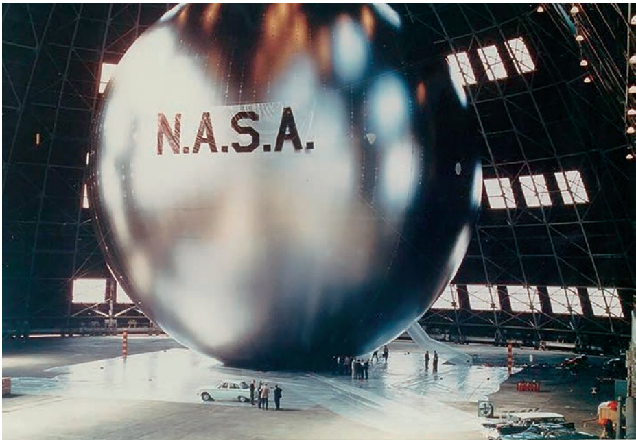
Satélite Echo IA , 1960.

En 1962, los norteamericanos consiguen poner en órbita el primer satélite activo, el Telstar I , capaz de proporcionar acceso a televisión de manera internacional, llamadas telefónicas e imágenes de telefotografía. Gracias a este