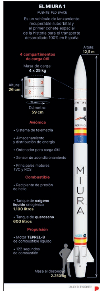
Cohete Miura I .

En total se invirtieron unos 223 millones de euros en unos servicios que se desarrollarían por unos 15 años (9). Ambos satélites cuentan con estabilización de tres ejes y una fiabilidad —demostrada en los años de servicio— igual a la de otros modelos similares puestos en órbita, los LS-1300 de Space Systems/Loral. En cuanto a sus características, llevan antenas de haces fijos y también orientables para maximizar la flexibilidad del sistema. En total, cada satélite puede proporcionar un ancho de banda