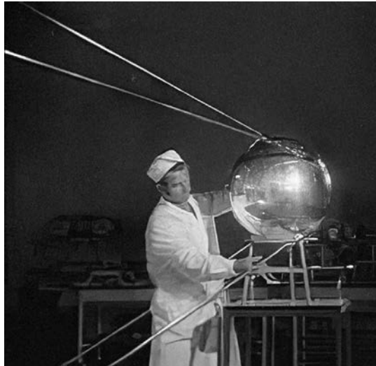
El Sputnik 1 , 1957.

Así pues, el 4 de octubre de 1957, los avances llevados a cabo permiten que la URSS se adelante a los Estados Unidos y realice con éxito el primer lanzamiento de un satélite artificial. El proyecto Sputnik («compañero de viaje» del ruso) incluyó el lanzamiento del primer satélite puesto en órbita gracias al vehículo R-7 Semioroka , que posteriormente se convertiría en el primer misil intercontinental fabricado. Era el Sputnik 1 , el pionero de un programa compuesto por cuatro satélites con forma esférica (sólo tres de ellos consiguieron orbitar con éxito alrededor de la Tierra). Con una masa de 83 kg y unas dimensiones de 58 cm de diámetro, contaba con antenas