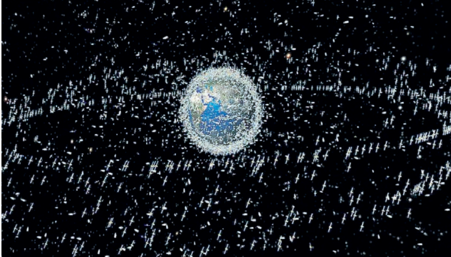
Satélites artificiales en órbita.

En cuanto a los satélites activos, en la actualidad hay aproximadamente 8.700 orbitando en diferentes alturas (6), número en continuo incremento gracias al monstruo tecnológico Starlink, de SpaceX, dirigido por el célebre multimillonario Elon Musk, que cuenta con 5.500 satélites y tiene permisos concedidos para alcanzar la escalofriante cifra de 30.000. Éstos son de baja órbita, dispuestos para el empleo de comunicaciones comerciales (internet); con la capacidad de desplazarse de manera autónoma, poseen comunicaciones de baja latencia entre la propia red de satélites, sin necesidad de establecer enlace con estaciones terrenas (7).