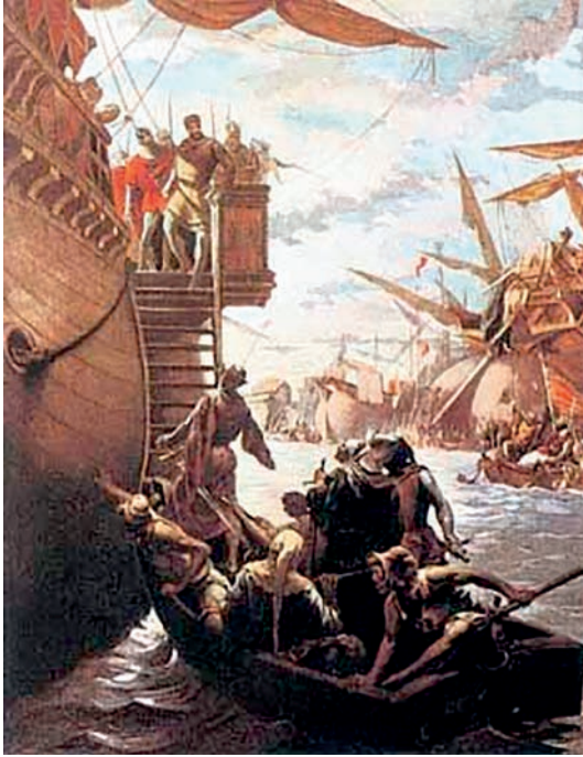
Momento de la pregunta del príncipe Carlos a Lauria. Óleo sobre lienzo de Ramon Tusquets Maignon pintado en 1885. (Imagen facilitada por el autor)

caballero?», A lo que nuestro protagonista contestó: «Yo lo soy»; a lo que repuso Carlos el Cojo: «Almirante, pues la fortuna os ha sido propicia, recibidme y a mis nobles compañeros; soy el Príncipe».