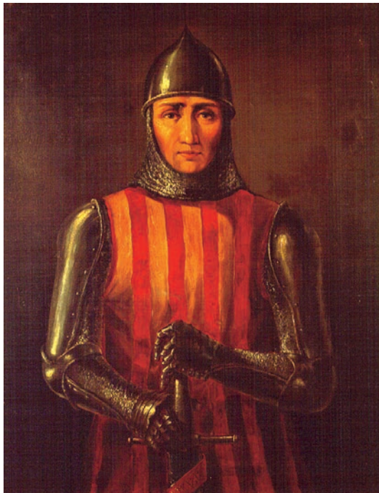
Roger de Lauria. Óleo sobre lienzo de un autor anónimo. (Museo Naval, Madrid)

En 1283, el Reino de Sicilia se había incorporado a la corona aragonesa por los derechos dinásticos de la reina Constanza II de Sicilia. Pero el rey Carlos I de Nápoles pretendía anexionarse esos territorios, y para impedirlo e ir al encuentro de las fuerzas napolitanas, Pedro III, al no fiarse de su hijo natural