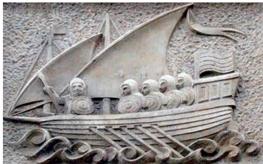
Altorrelieve al estilo medieval de la galera capitana de Roger de Lauria situado en la calle que lleva su nombre en la Ciudad Condal.

La maniobra de las galeras aragonesas fue tan audaz como temeraria ya que las embistieron por el través pasándolas por el ojo, mientras que en la pelea cuerpo a cuerpo tras el abordaje, la mayor pericia guerrera de los aragoneses se impuso rápidamente. Ante aquel panorama, algunas galeras galas huyeron buscando refugio en el puerto, pero fueron perseguidas implacablemente por las de Lauria que lograron apresar a una decena. Mientras tanto la lucha por la toma del control de la galera real del príncipe Carlos era terrible, y ante esta numantina resistencia, Lauria ordenó barrenarla (17), por lo que el galo, ante el temor de morir ahogado, se embarcó en un bote acercándose sin saberlo al costado de la galera insignia de Lauria, preguntando en voz alta: «¿Hay entre vosotros algún