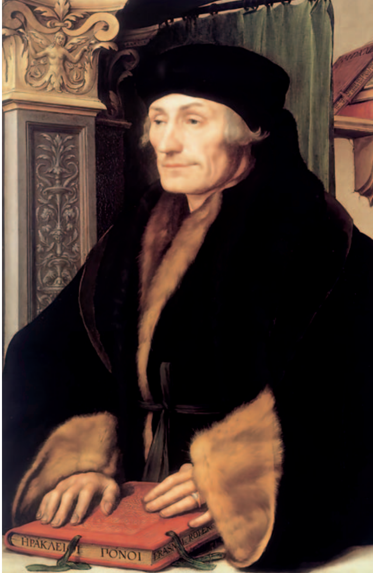
Erasmus de Róterdam.

«Naturalmente, hablo de las guerras que, por las causas más fútiles e injustas, terminan enfrentando a los cristianos entre sí. No me refiero a las guerras en que los cristianos, animados por un empeño puro y piadoso, rechazan la violencia de los invasores bárbaros y defienden, arriesgando sus vidas, la tranquilidad común» (Erasmus, 2020: 64).