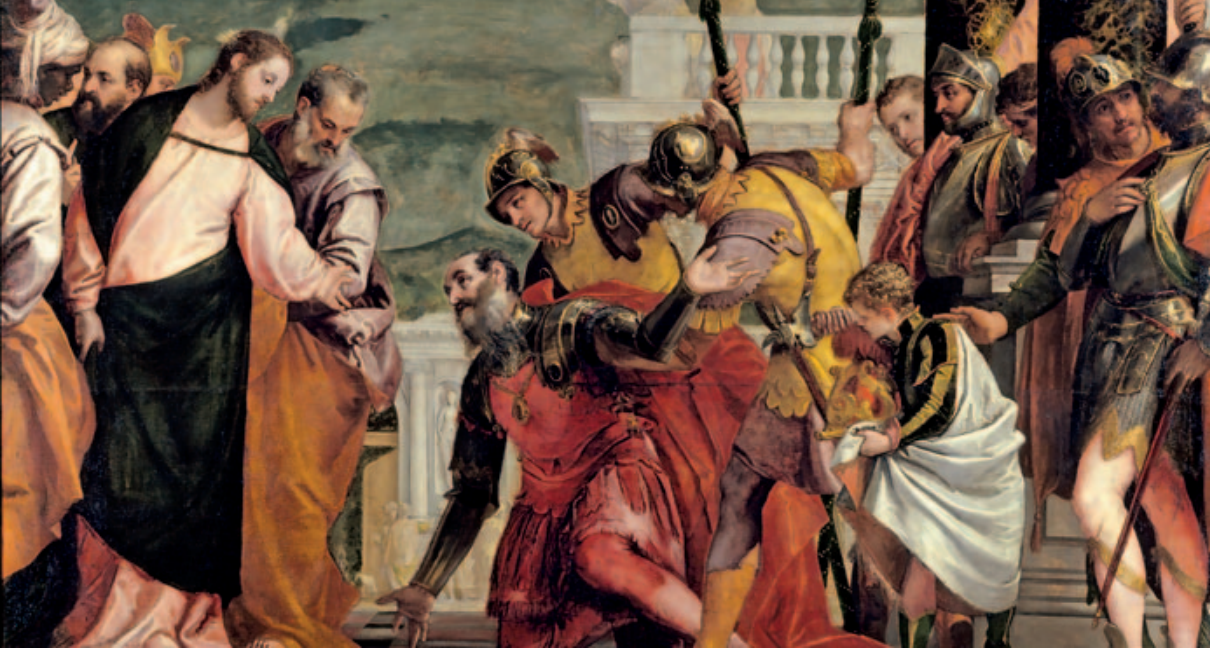
Representación de la curación del sirviente del centurión.

Ningún reproche; sí un elogio que viene de Dios. Nada menos.