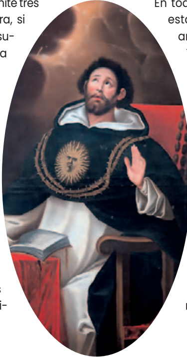
Santo Tomás de Aquino. (Fuente: www.wikipedia.org )

En esencia, santo Tomás admite tres justas causas para la guerra, si bien también pueden ser asumidas como una justa causa basal y dos derivados de la misma. A saber: la legítima defensa; la defensa contra santuarios de grupos armados irregulares 1 , también llamada «guerra contra agresiones indirectas», y la guerra para exigir reparaciones derivadas de agresiones previas, denominada «guerra punitiva» (santo Tomás: Qu. 40, art. 1). Sobre esa base, que asumen con escasos matices todos los teóricos posteriores, católicos o no, el fraile dominico y profesor de la Universidad de Salamanca Francisco de