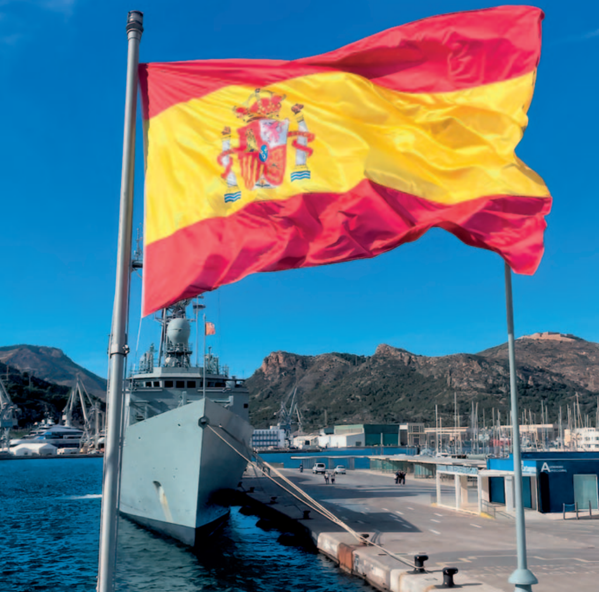
Fragata Numancia desde la popa de la Blas de Lezo .