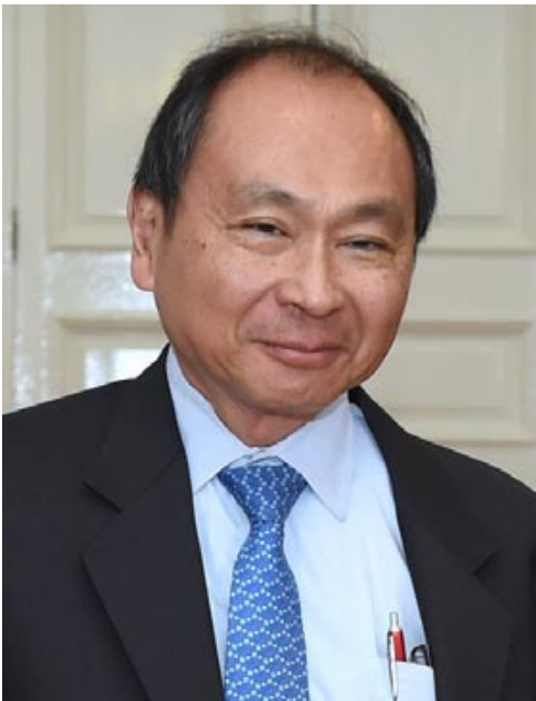
Francis Fukuyama.

De hecho, la teoría de la guerra justa es básicamente católica (esta palabra, que significa «universal», ya se empleaba en el siglo II). San Agustín y santo Tomás son sus principales pilares, sin perjuicio de que el concepto original reciba alguna aportación sustantiva del también católico Francisco de Vitoria, del protestante Hugo Grocio y, ya en tiempos muy recientes, del judío Michael Walzer. Lo planteo así para mostrar que una doctrina originariamente católica ha sido continuada por