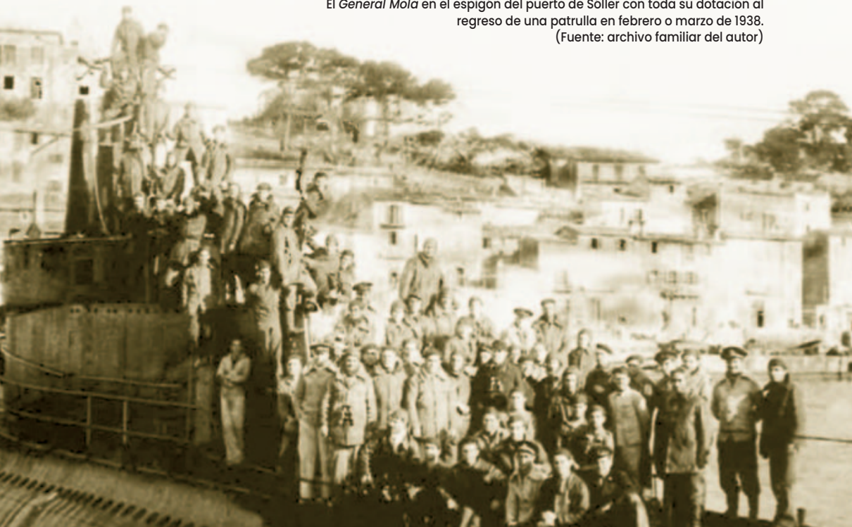
El General Mola en el espigón del puerto de Sóller con toda su dotación al regreso de una patrulla en febrero o marzo de 1938.

La Marina intentó crear un ambiente cerrado y controlado, investigando a los residentes del Través y el Port y reubicando a quienes no se consideraban de confianza. Además, el Lazareto se utilizó como prisión para milicianos capturados durante el desembarco