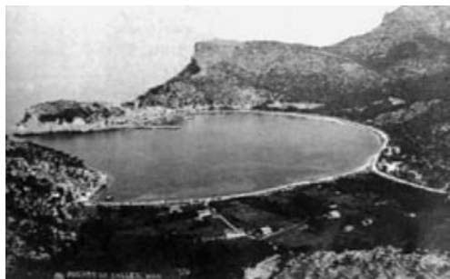
El puerto de Sóller a principios del siglo XX.

(Rafael Fernández de Bobadilla y Ragel, primer comandante del submarino General Mola )