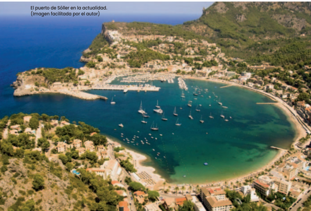
El puerto de Sóller en la actualidad.

El puerto de Sóller nunca fue bombardeado ni por aire ni por mar, a pesar de que se cree que los republicanos sabían de la existencia de la base.