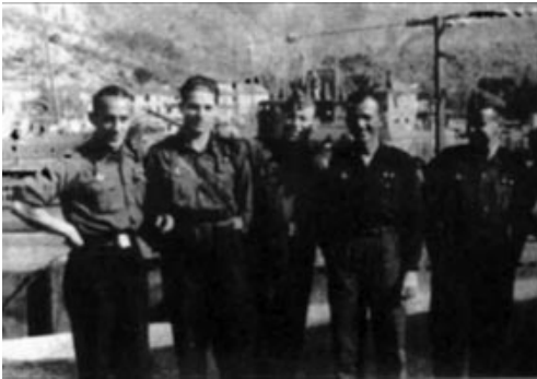
Oficiales italianos en el espigón interior del puerto de Sóller. Tras ellos, un submarino clase Archimede y el Iride .

El Hotel Marisol se convirtió en alojamiento para la marinería italiana, pero no fue el único, ya que había alrededor de 120 marineros en el puerto. Los españoles, por su parte, eran en su mayoría jóvenes universitarios o hijos de familias acomodadas que se alistaron voluntariamente y que se juntaban para alquilar pisos o habitaciones —se supone que en la calle Marina— que compartían con los miembros de la tripulación del otro submarino, ya que no coincidían a la vez en puerto. Cuando esto ocurría, aprovechaban para ir a Sóller,