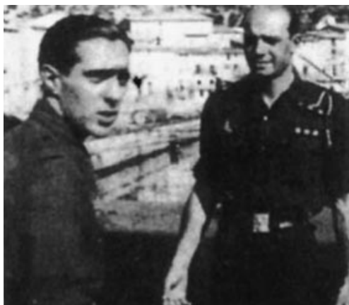
Oficiales italianos en el espigón interior del puerto de Sóller. Septiembre-octubre de 1937.

Antes de 1936, Mallorca estaba desmilitarizada, y la instalación de una base naval en Sóller fue una sorpresa para los habitantes de la isla. Sin embargo, con el tiempo el puerto se convirtió en un centro clave para la Marina, con submarinos y marinos italianos y españoles operando allí.