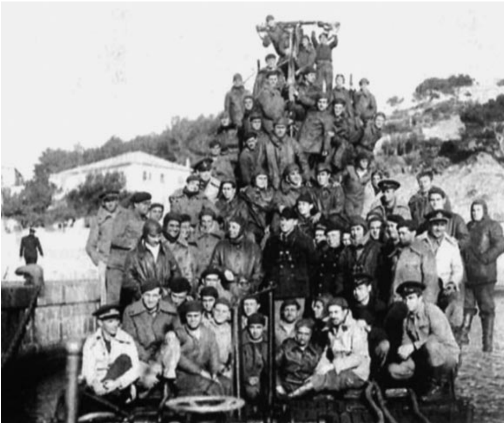
Dotación del General Mola en el puerto de Sóller en febrero o marzo de 1938.

Un informe italiano de febrero de 1936 lo describía como un pequeño puerto agrícola que fue transformado en una base naval que en pocos meses se alistó para albergar submarinos y lanchas torpederas. Aunque los españoles consideraban que la base de Mahón era la más adecuada, Sóller seguía siendo un buen punto de apoyo para las unidades. El informe destacaba las instala-