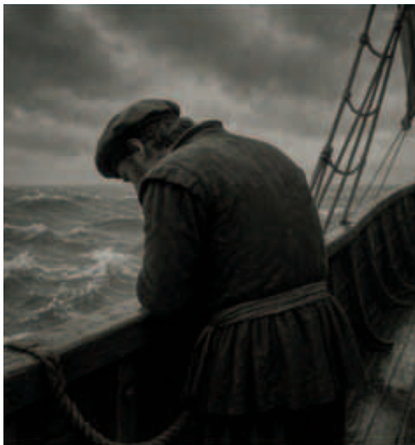
Marinero soportando el mar de mares. (Recreación realizada por Rosa Lorenzo con IA)

Otra sentencia, no menos ingeniosa, asegura que «ante la mar hay dos clases de personas: