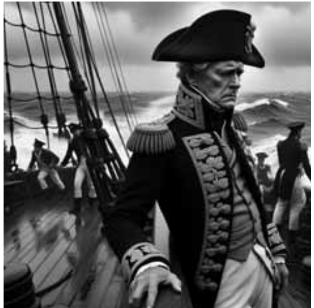
Mando naval con claros síntomas de mareo. (Recreación realizada por Rosa Lorenzo con IA)

El vaivén constante de un barco, ya sea por el cabeceo, el balanceo o una combinación de ambos, puede convertirse en el peor enemigo de quienes se aventuran a navegar. El llamado mareo de mar es en realidad un trastorno del equilibrio que afecta a la gran mayoría de las personas en algún momento, y sólo existen rarísimas excepciones de marineros y pasajeros que jamás han sentido sus efectos o que lograron vencerlos con el tiempo