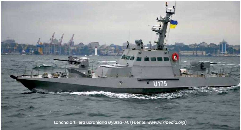
Lancha artillera ucraniana Gyurza-M.

doctrina clara de protección de fuerza verán erosionada su libertad de acción, especialmente cerca de la costa.