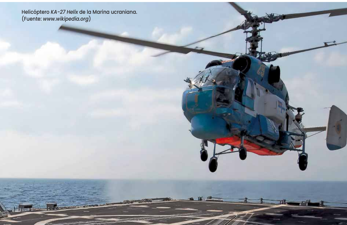
Helicóptero KA-27 Helix de la Marina ucraniana.

Y finalmente, más allá de la tentación de emular el modelo ucraniano, la literatura reciente