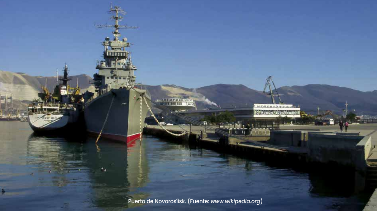
Puerto de Novorosiisk.

por aliados, conectadas por centros de mando con inteligencia en tiempo real. La guerra ha fomentado una estrecha colaboración entre la Marina ucraniana, la industria tecnológica y los centros de innovación; mantener esa agilidad en tiempos de paz será clave para conservar la ventaja cualitativa demostrada. Paralelamente, Kiev ha reforzado su cooperación con Rumanía, Turquía o Bulgaria, por lo que cabe esperar más ejercicios conjuntos, intercambio de inteligencia y esfuerzos coordinados de guerra antisubmarina y de minas para garantizar la seguridad de la navegación en el mar Negro.