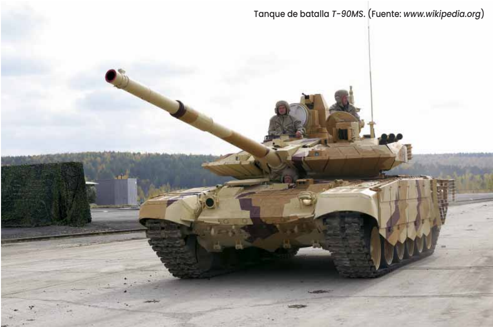
Tanque de batalla T-90MS.

En las primeras horas de la invasión, Rusia se apresuró a capturar la estratégica isla de las Serpientes, situada al noroeste del mar Negro. Esta pequeña roca tiene un valor geoestratégico desproporcionado: quien la controle puede instalar sensores y sistemas de defensa que cubran el sector noroccidental del mar 5 . Durante la ocupación inicial, Moscú desplegó radares y baterías antiaéreas para construir una burbuja A2/AD que protegiera sus operaciones y contribuyera al bloqueo de los puertos ucranianos. Con la isla como puesto avanzado, las fuerzas rusas amenazaban directamente Odesa y la desembocadura del Danubio, mientras declaraban un bloqueo na-