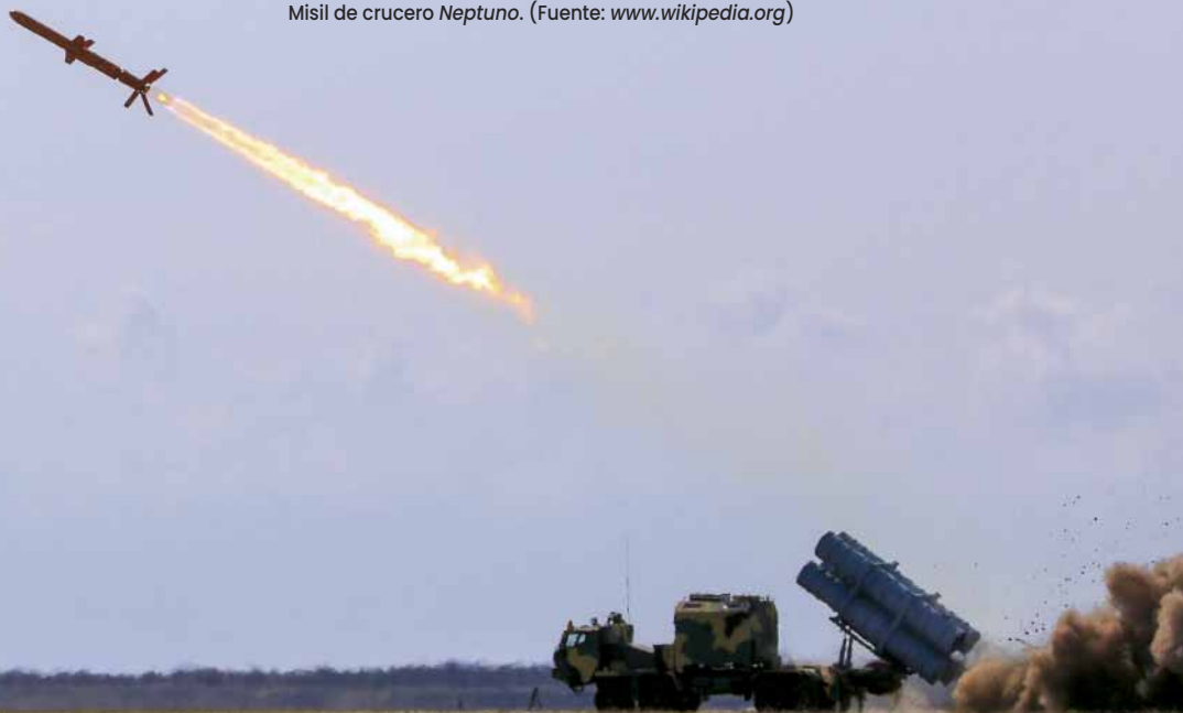
Misil de crucero Neptuno .

Otra línea de reflexión es la adaptación de la protección de fuerza a la era de los drones y la munición de precisión asequible. Ucrania ha demostrado que sistemas relativamente baratos pueden infligir daños estratégicos si no se cuenta con defensas multicapa eficaces. Para las marinas occidentales ello se traduce