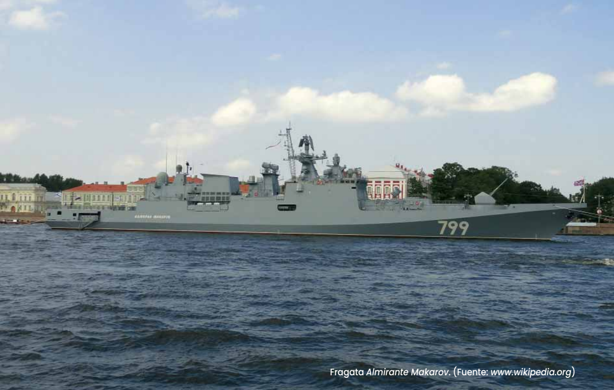
Fragata Almirante Makarov .

conflicto Rusia perdió o sufrió daños graves en alrededor de un tercio de los buques de guerra desplegados en la región. Además del Moskvá , el submarino Rostov-na-Donu y varios buques anfibios de la clase Ropucha fueron hundidos o inutilizados 12 .