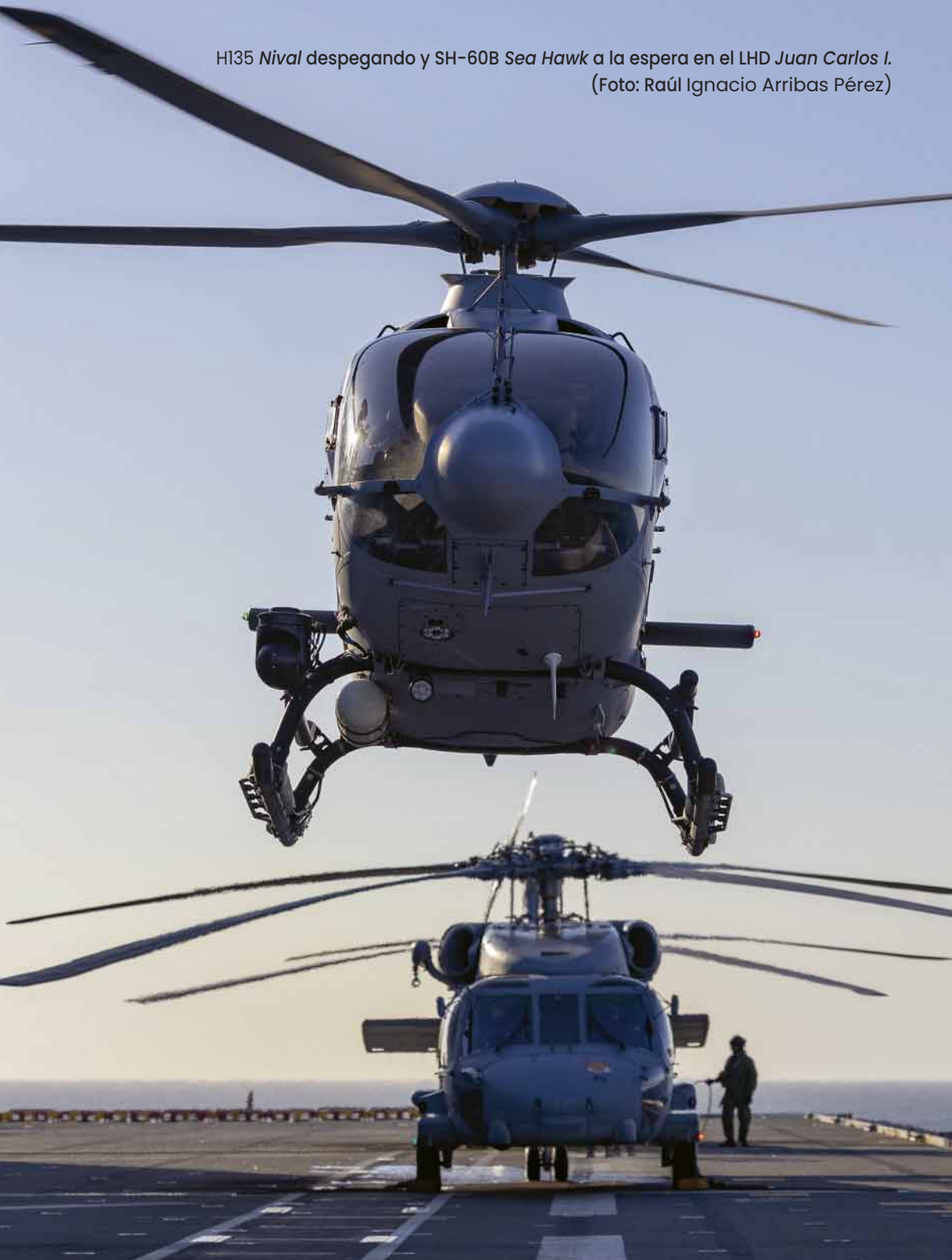
H135 Nival despegando y SH-60B Sea Hawk a la espera en el LHD Juan Carlos I.