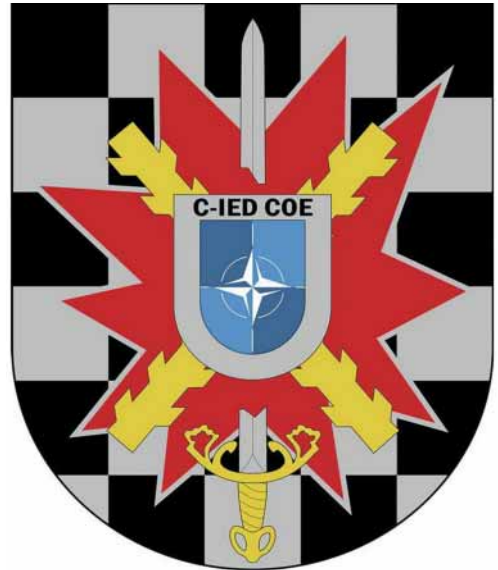
Escudo del CoE C-IED.