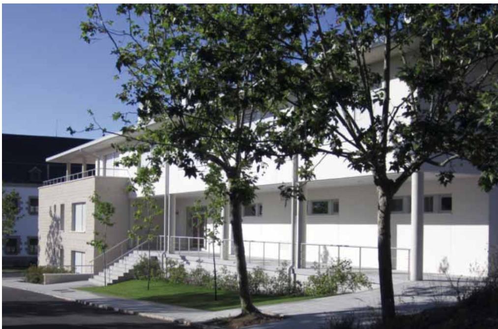
Entrada a la residencia.

representadas todas las naciones patrocinadoras y se aprueban el programa de trabajo anual, el presupuesto y las políticas de funcionamiento del Centro.